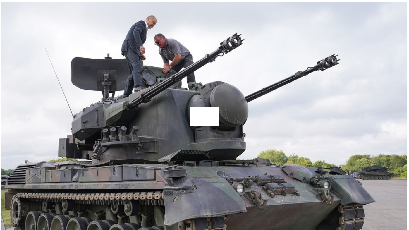
La Suisse interdit à l'Allemagne de transmettre des munitions suisses à l'Ukraine / Le Journal horaire / 24 sec. / aujourd'hui à 15:02

La Suisse a interdit mercredi à l'Allemagne d'envoyer en Ukraine les munitions de fabrication suisse destinées aux chars de défense antiaérienne que Berlin veut livrer à Kiev, qui dit en avoir cruellement besoin.