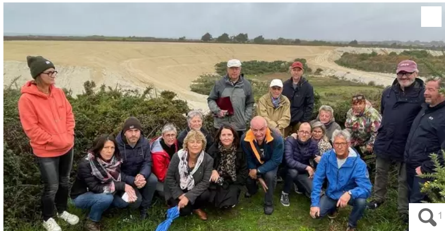
Les riverains des Kaolins ont grimpé en haut de la butte du Courégant, avec l'idée de mesurer l'impact de la carrière gérée par Imerys, notamment sur les paysages et l'eau.

L'association des riverains des kaolins, à Ploemeur (Morbihan) partage les constatations de la Mission régionale d'autorité environnementale (MRAe), dans son avis rendu public le 30 septembre 2022 : celui-ci concernait le projet de renouvellement d'exploitation et d'extension de la carrière. L'association s'en trouve renforcée dans son opposition.