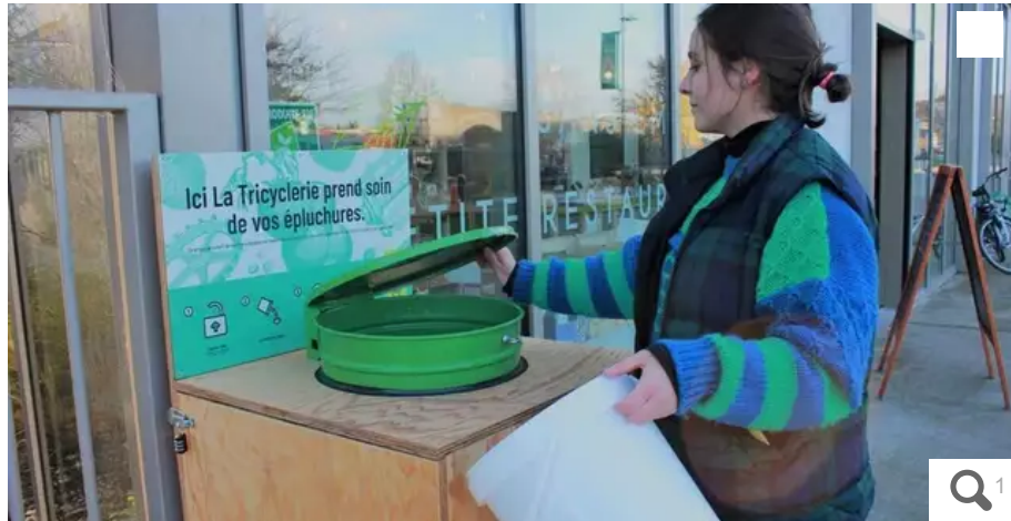
La Tricyclerie collecte les déchets d'entreprise des particuliers pour en faire du compost. Un service très utile et écolo mais qui va prendre fin, la coopérative déposant le bilan. Ses clients demandent un soutien de Nantes métropole.