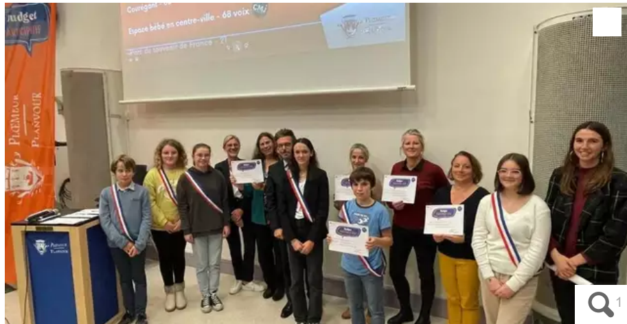
Mercredi 16 novembre 2022, à Océanis, lors de l'annonce des résultats des votes pour le budget participatif.

Au terme d'une campagne de trois semaines, cinq projets seront finalement financés dans le cadre du premier budget participatif de la Ville de Plœmeur (Morbihan).