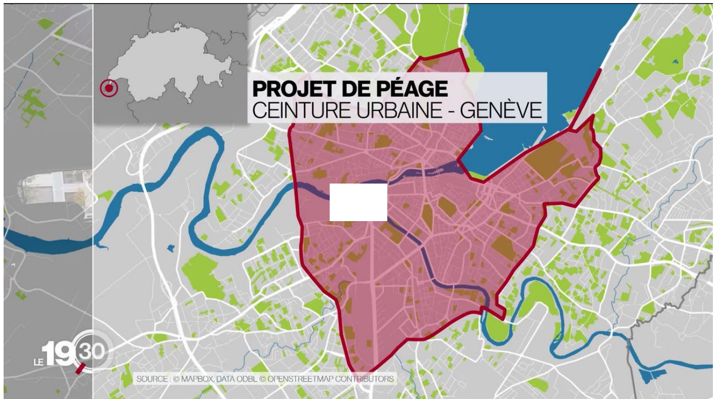
A Genève, le projet de péage urbain pour réduire les bouchons divise / 19h30 / 2 min. / aujourd'hui à 19:30