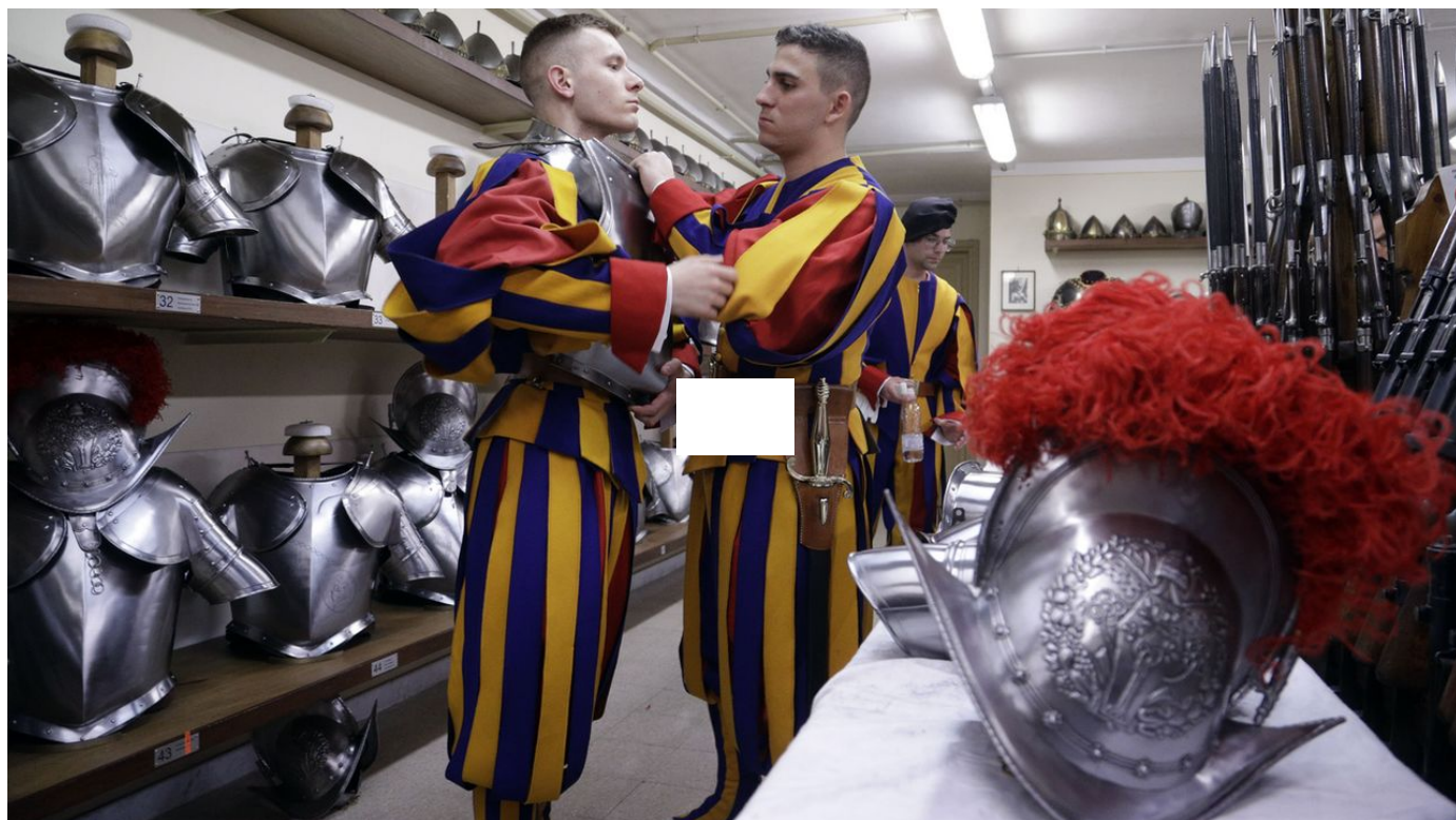
Le million de francs que le Valais a promis pour la future caserne de la garde pontificale au Vatican est contesté / La Matinale / 1 min. / vendredi à 06:18

En Valais, le million de francs que le canton a promis pour la future caserne de la garde pontificale au Vatican est contesté. Une pétition vient d'arriver dans toutes les boîtes aux lettres du canton. Elle s'intitule "Le million devant le peuple".