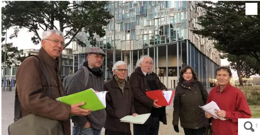
Les membres des associations environnementales de l'agglomération de Lorient comme Eau et rivières, Bretagne vivante, Terre de liens ou l'association défense de l'environnement de Caudan unissent leurs voix pour alerter sur les pertes de terres agricoles.

Une douzaine d'associations environnementales de l'agglomération de Lorient (Morbihan) s'inquiètent des pertes de terres agricoles engendrées par l'extension de ses zones d'activités. Elles demandent un débat public.