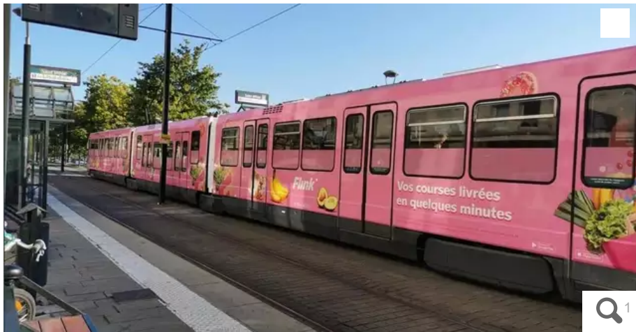
C'est ce visuel pour la société de livraison de courses qui a précipité la fin de la pub sur les tramways à Nantes.

Depuis la polémique sur les dark stores fin septembre, la Semitan décidait de renoncer aux publicités sur ses tramways... Et aux recettes qui allaient avec.