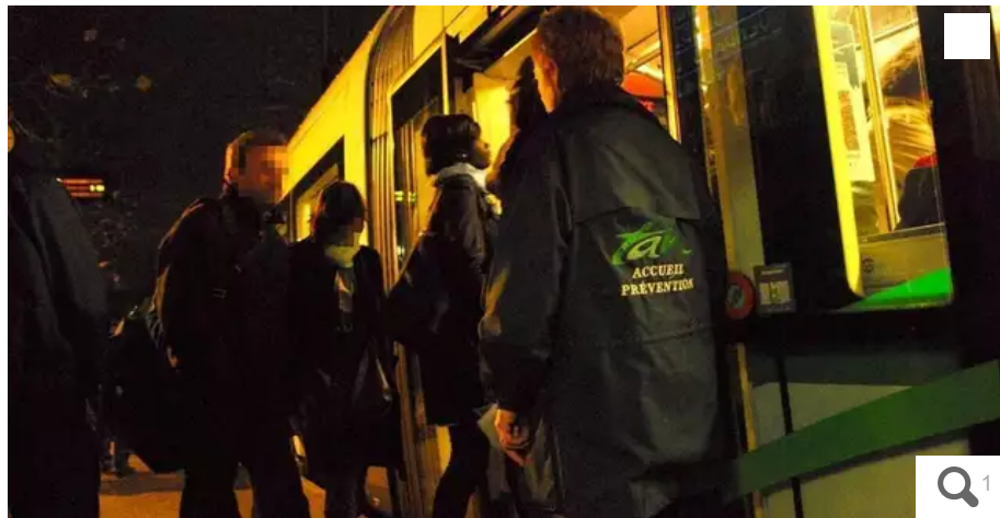
La circulation des tramways et des bus sera interrompue à 21 h 30 dans le centre-ville de Nantes, mercredi 14 décembre, soir de match France-Maroc.

La direction de la Semitan a entendu l'inquiétude de ses agents : à partir de 21 h 30 mercredi 14 décembre, aucun bus ni tram ne circulera dans le centre-ville de Nantes, à l'instar de ce qui se pratique lors des manifestations sur la voie publique. Les salariés s'inquiètent de possibles débordements à l'issue du match de coupe de monde de football opposant la France au Maroc.