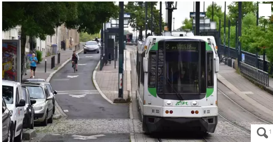
La ligne 2 du tramway sera coupée à 50-Otages.

La direction de la Semitan confirme l'application du dispositif en place lors des manifestations sociales en ville : à l'occasion du match France-Maroc, aucun bus ni tram ne circulera dans le cœur de la ville de Nantes, à partir de 21 h 30 mercredi 14 décembre 2022.