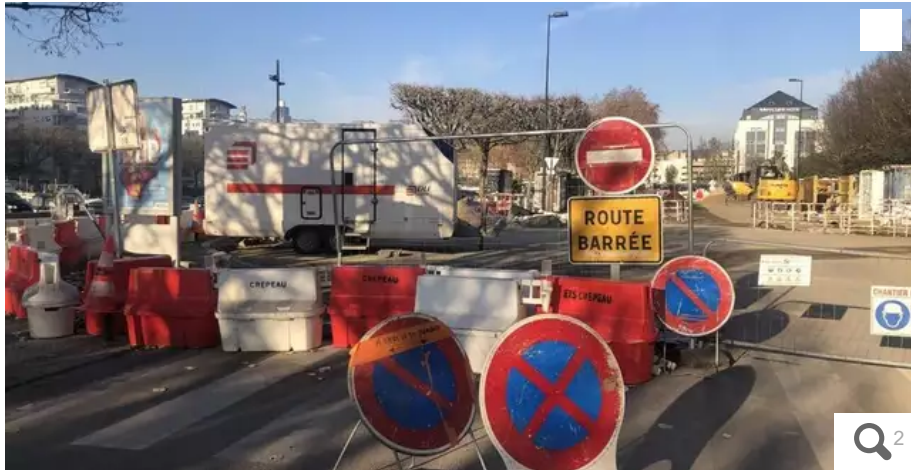
Le quai de Malakoff est en travaux, par phases, jusqu'à l'été prochain.

Le parvis sud de la gare de Nantes livré, les projets se poursuivent jusqu'en 2025. Des busways plus économiques seront déployés à partir de janvier sur la ligne 5.