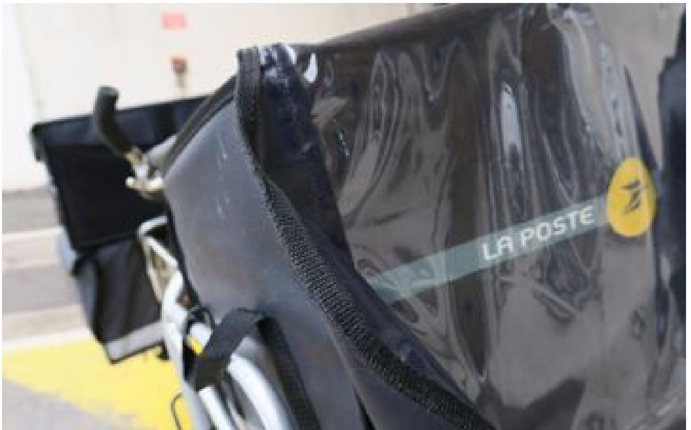
Yvelines : le faux employé de la Poste vidait les boîtes aux lettres... 700 000 euros de préjudice