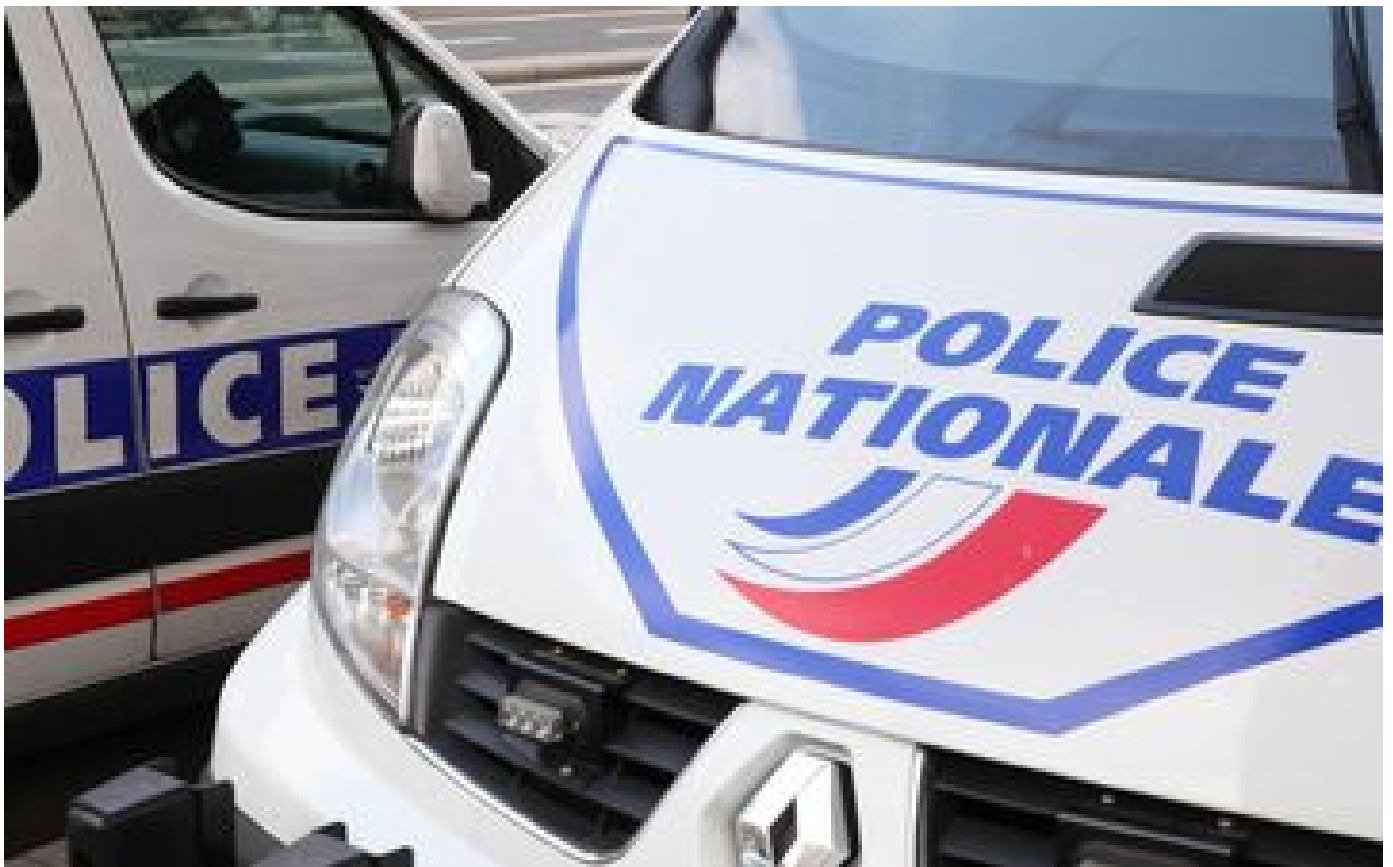
Marseille : nouvel homicide par balles, sur fond de trafic de drogue