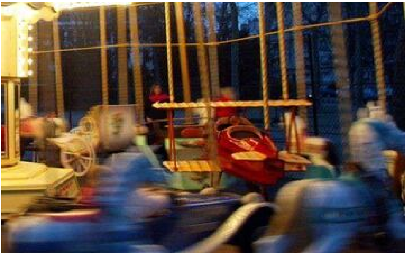
Montpellier : un accident de manège fait plusieurs blessés légers