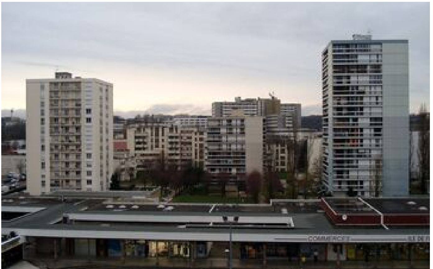
Besançon : un adolescent de 15 ans tué par balle