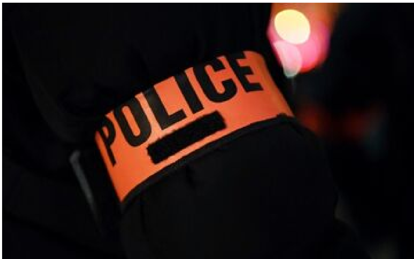
Cahors : le corps d'un cinquantenaire retrouvé en sang, un autre homme placé en garde à vue