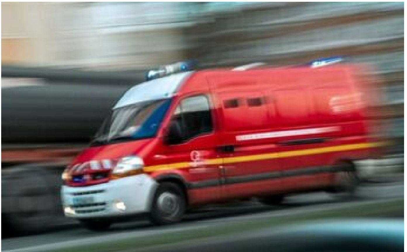
Vendée : le mariage vire au cauchemar, 13 personnes intoxiquées au monoxyde de carbone