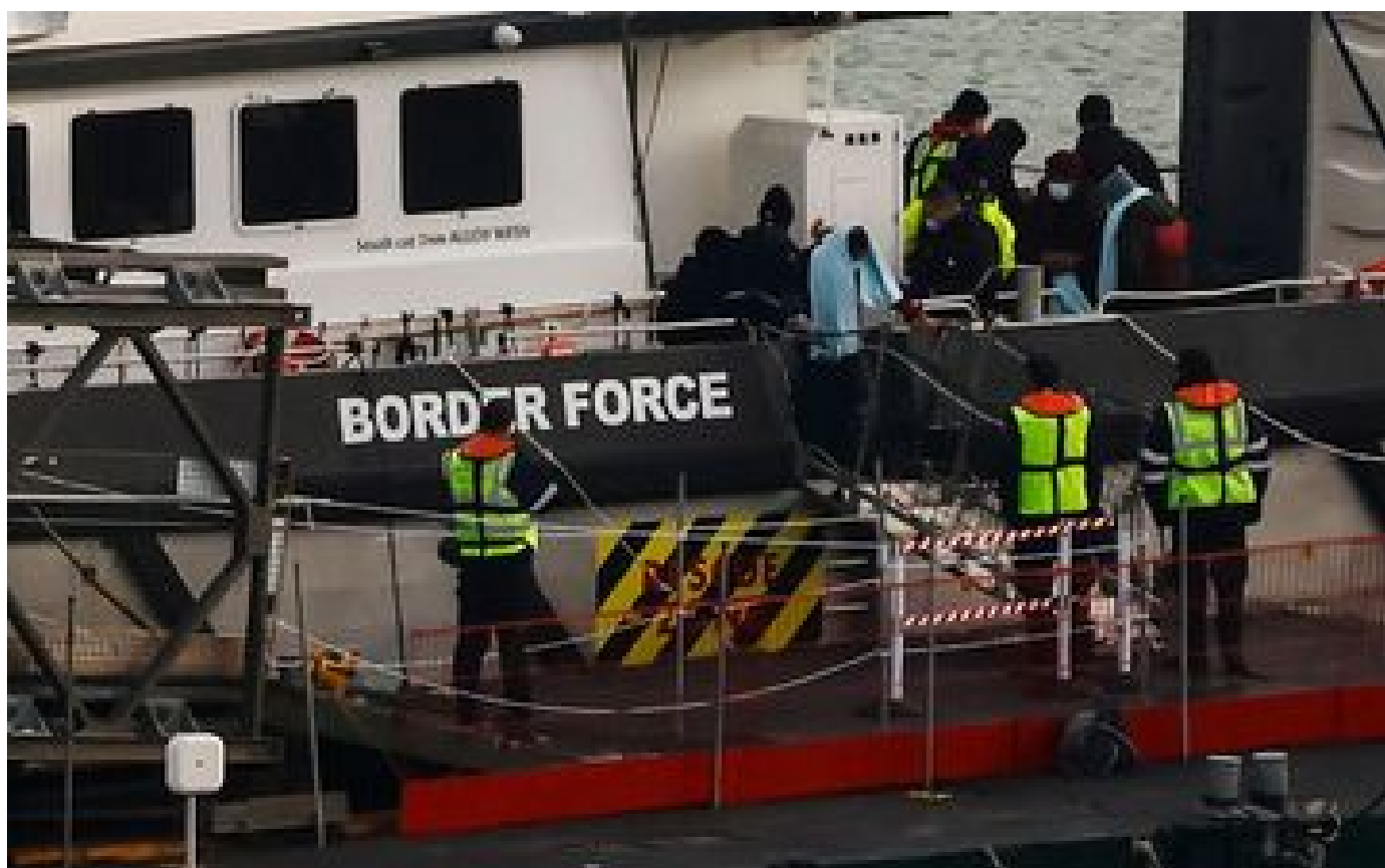
Royaume-Uni : un homme inculpé après la mort de quatre migrants dans la Manche