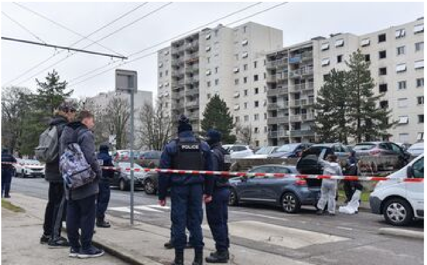
Incendie de Vaulx-en-Velin : six adultes et quatre enfants sont morts, corrige le parquet