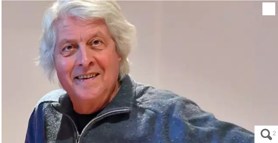
Jean-Paul Corbineau, l'un des trois piliers de Tri Yann, s'est éteint.

Une messe sera célébrée vendredi 23 décembre en l'église Sainte-Thérèse à la mémoire de Jean-Paul Corbineau, qui s'est éteint le 16 décembre. Un hommage familial lui sera rendu le lundi 26 décembre au cimetière Miséricorde.