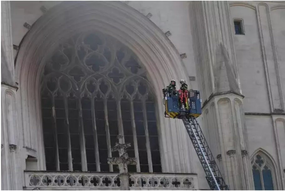
Incendie à la cathédrale de Nantes : la dépollution et la restauration doivent encore durer au moins deux ans.

pas encore fixé. L'estimation des dégâts est loin d'être achevée. En février, la Direction régionale des affaires culturelles (Drac) chiffrait les travaux à 24 millions d'euros. La dépollution et la restauration doivent encore durer au moins deux ans.