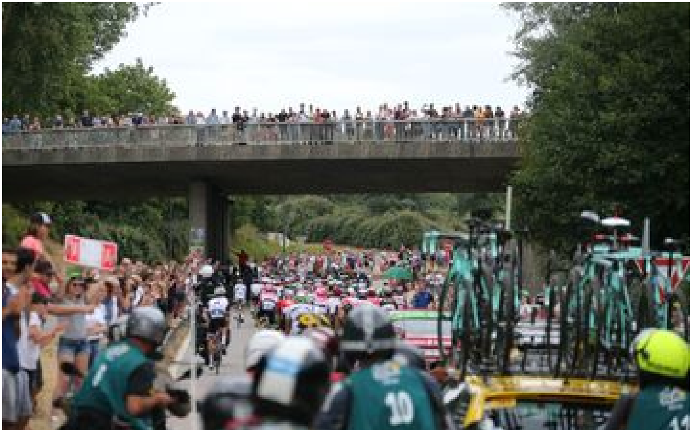
Abonnés Chatou, Poissy, Versailles, Meudon... les meilleurs spots pour voir passer le peloton du Tour de France