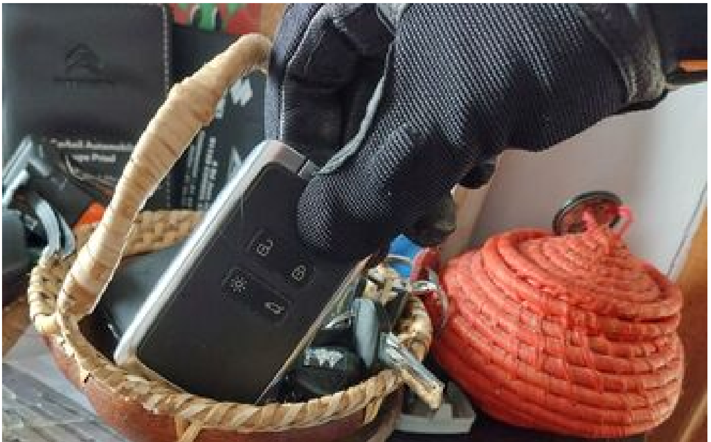
Un SUV de luxe volé lors d'un home-jacking à Feucherolles