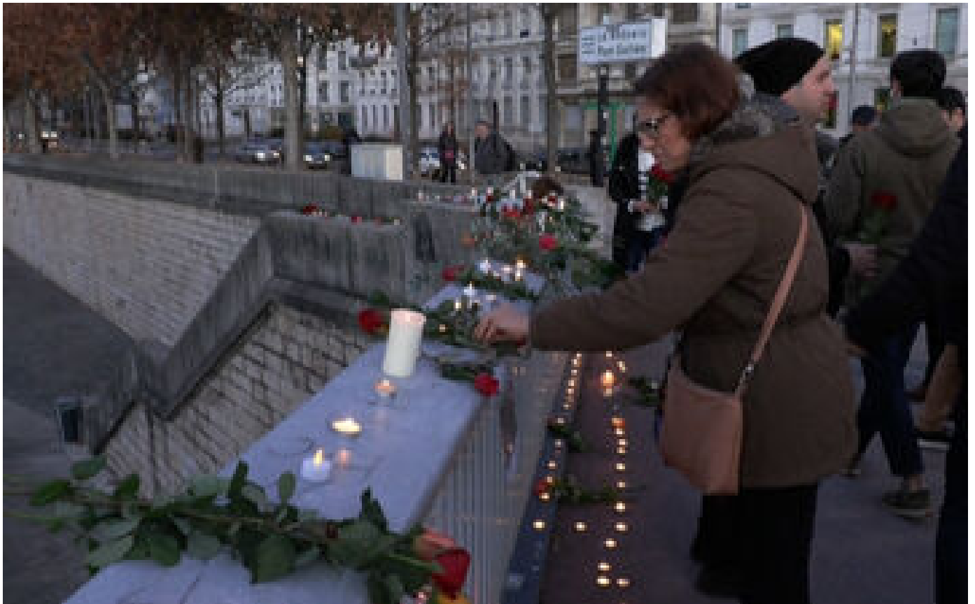
VIDÉO. Suicide d'un Iranien à Lyon : « Son cœur battait pour l'Iran, il ne supportait plus ce régime »