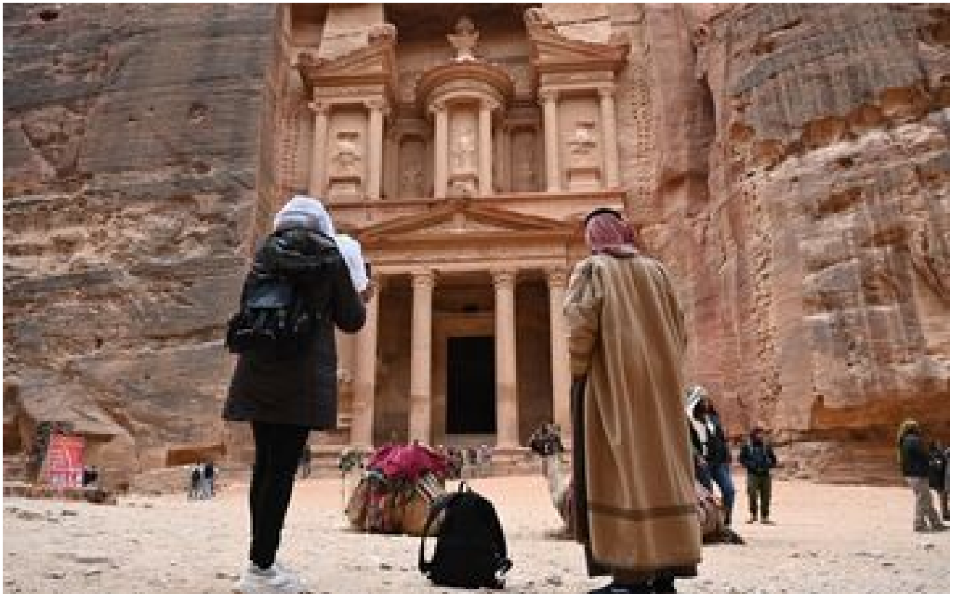
VIDÉO. Petra : des touristes fuient des inondations spectaculaires sur le site archéologique jordanien