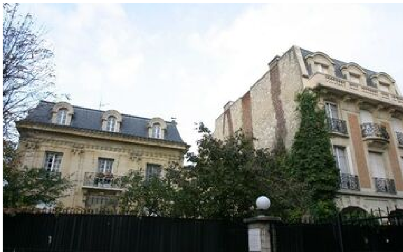
Abonnés Impôts sur le revenu : les 10 villes d'Île-de-France où habitent les plus riches