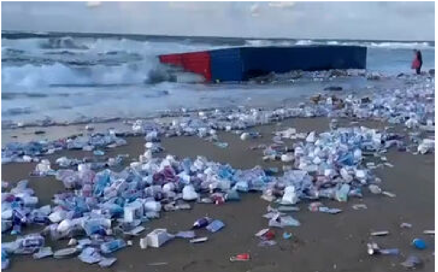
VIDÉO. Israël : des conteneurs s'échouent sur une plage, les habitants se servent