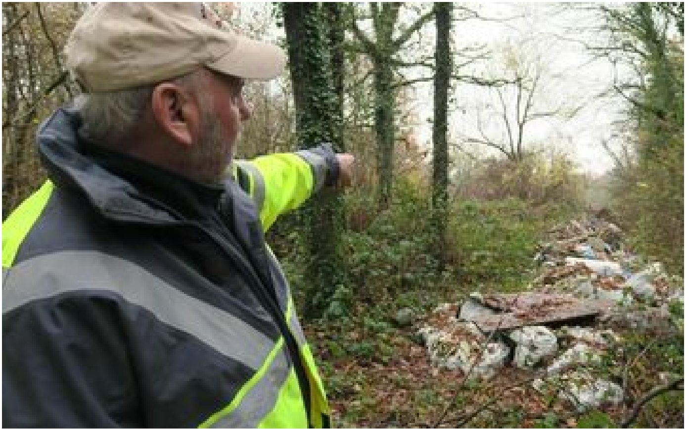
Abonnés Dépôts sauvages : gendarmes et élus des Yvelines se coordonnent pour mieux lutter contre ce fléau