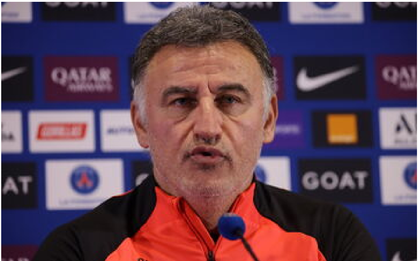
VIDÉO. PSG : Galtier veut faire «récupérer Mbappé et Hakimi sur le plan mental»