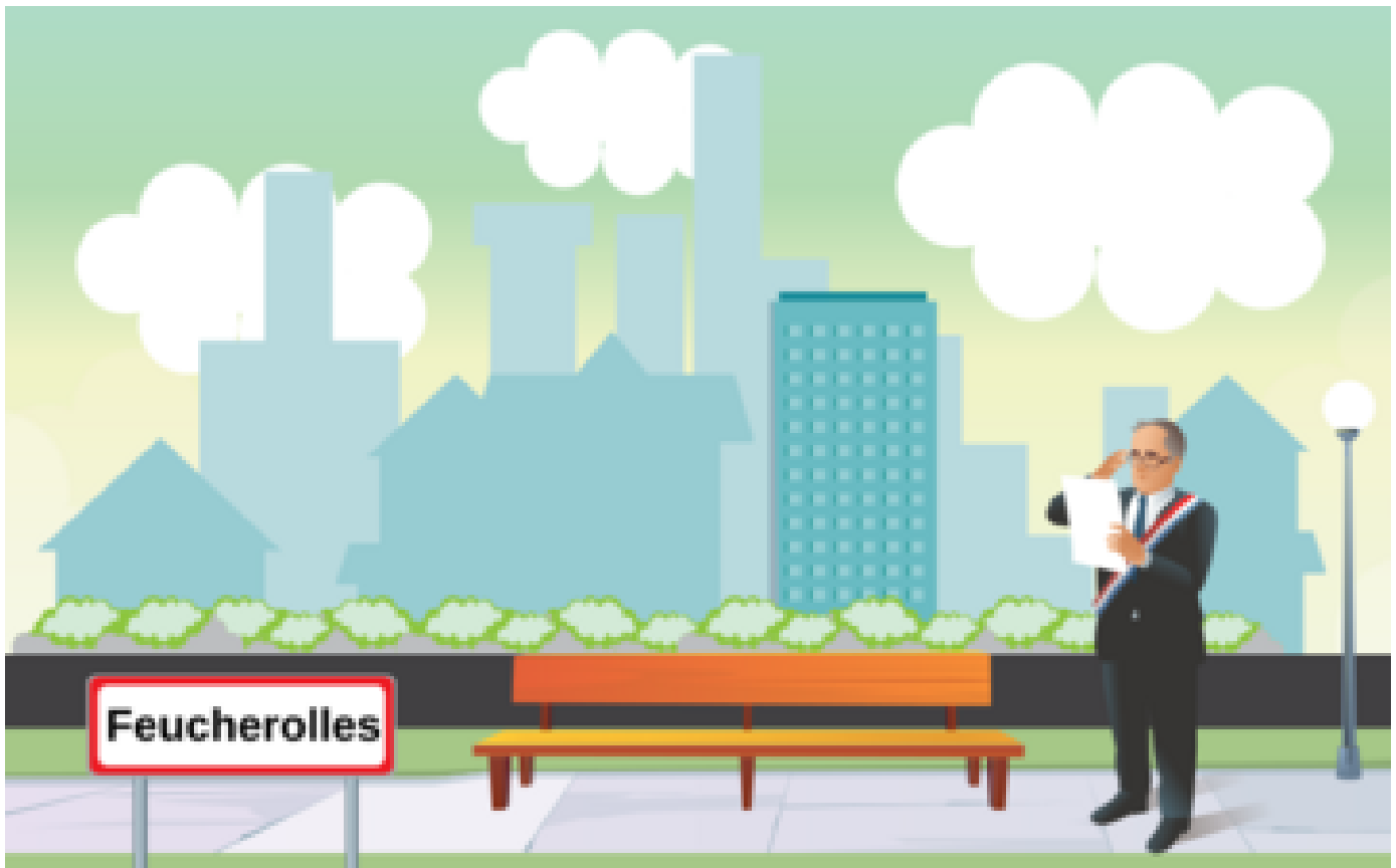
Liste des candidats à Feucherolles pour les élections municipales 2020