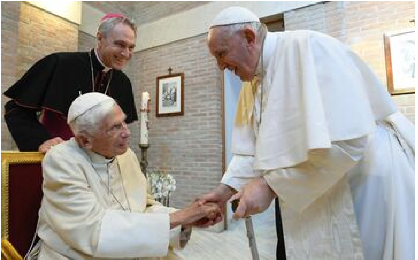
Le Vatican confirme que l'état de santé de Benoît XVI «s'aggrave», le pape François «prie» pour lui