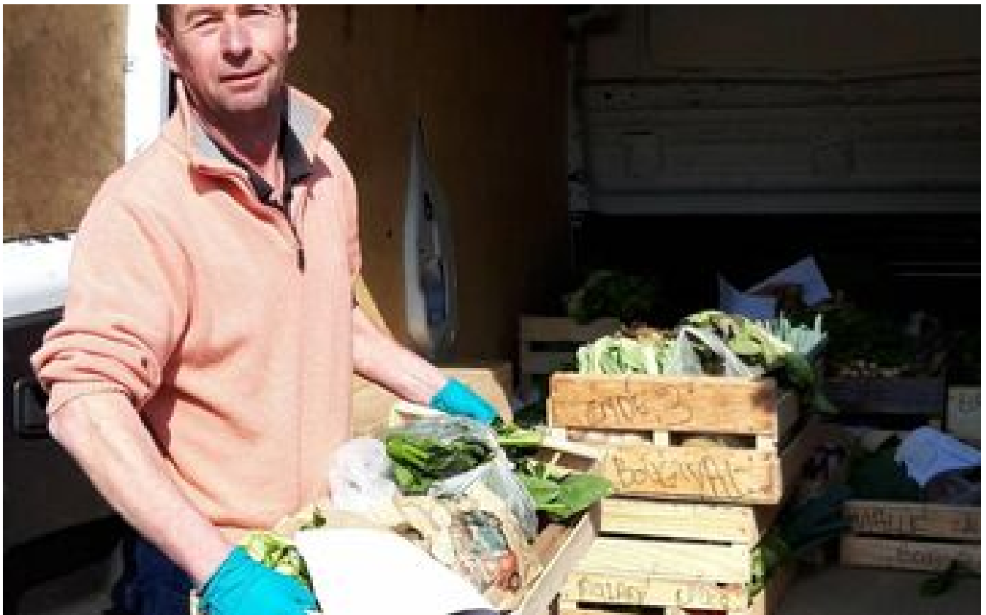
Confinement dans les Yvelines : les produits fermiers pris d'assaut