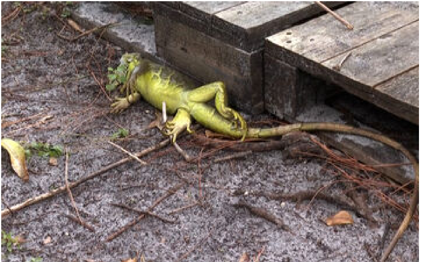
VIDÉO. « Il fait tellement froid qu'ils n'ont plus de force » : ces iguanes gelés qui tombent des arbres aux États-Unis