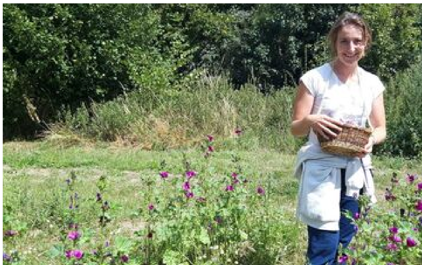
L'herboriste lance sa gamme de produits bio à Feucherolles