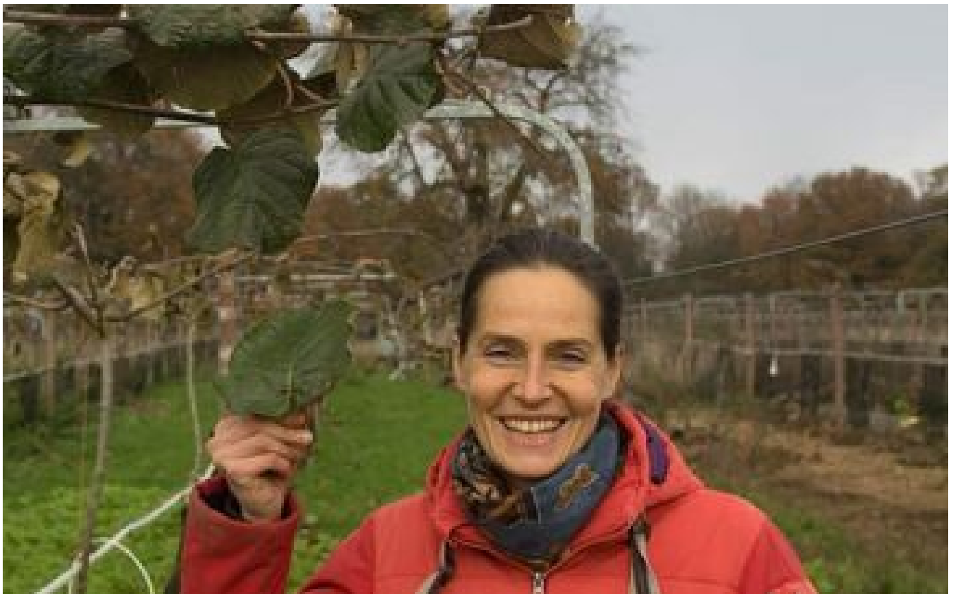
Abonnés «Ma locomotive, c'est le kiwi» : à 35 km de Paris, cette arboricultrice mise tout sur ce fruit exotique