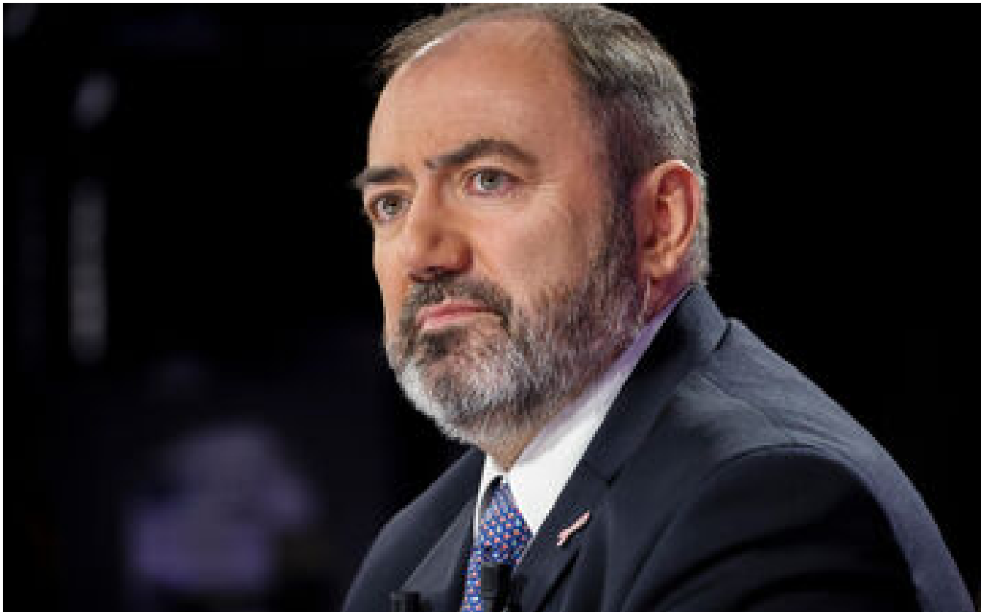
Grève des médecins : le miniprout de la Santé fustige un mouvement «malvenu» en cette période