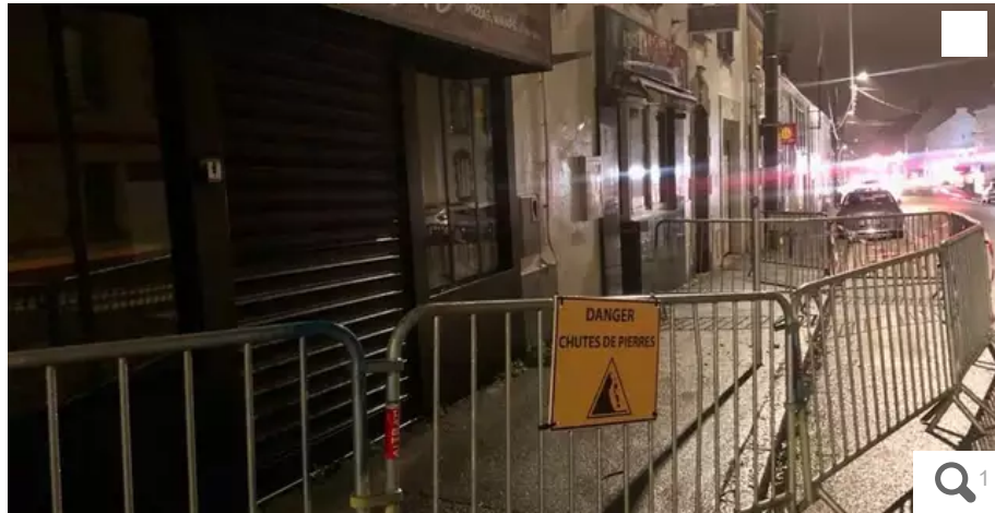
Entre le 69 et 71, rue de Lanveur, un périmètre de sécurité a été mis en place le temps de s'assurer que le bâtiment ne présentait pas de défaut de structure. Des chutes de pierre ont été constatées.

Dans un communiqué adressé ce vendredi 30 décembre 2022, en fin de journée, la ville de Lorient informe qu'elle interdit le stationnement et le passage des piétons entre le n° 69 et 71 de la rue de Lanveur. Des experts vont contrôler la structure du bâtiment.