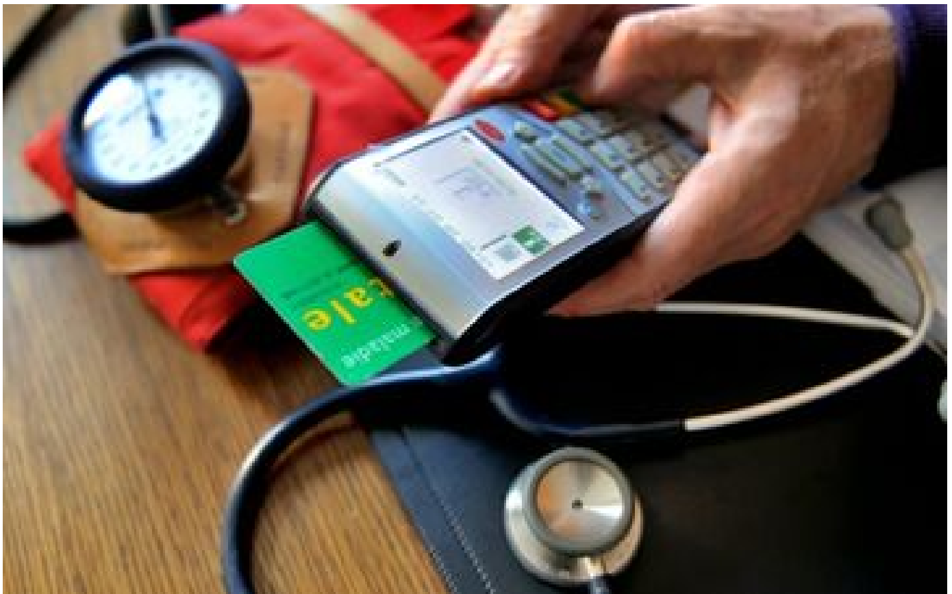
Eure-et-Loir : « Nous sommes médecins et nous avons l'impression d'être des délinquants », les médecins de garde en grève réquisitionnés par les gendarmes à Chartres