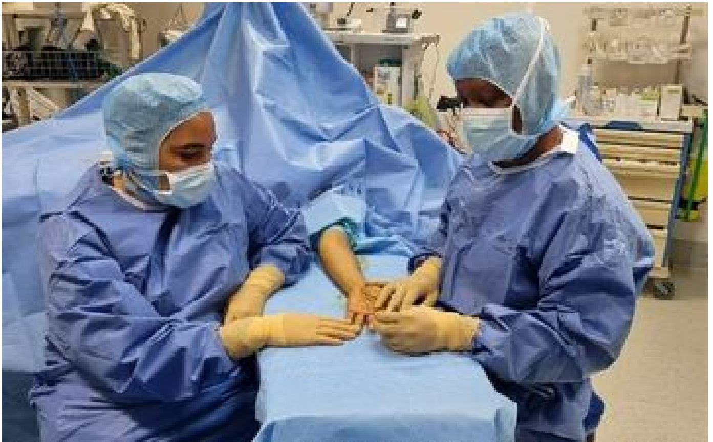
Abonnés Nouvel An : accidents domestiques, mortiers d'artifice... les chirurgiens de la main sur le qui-vive