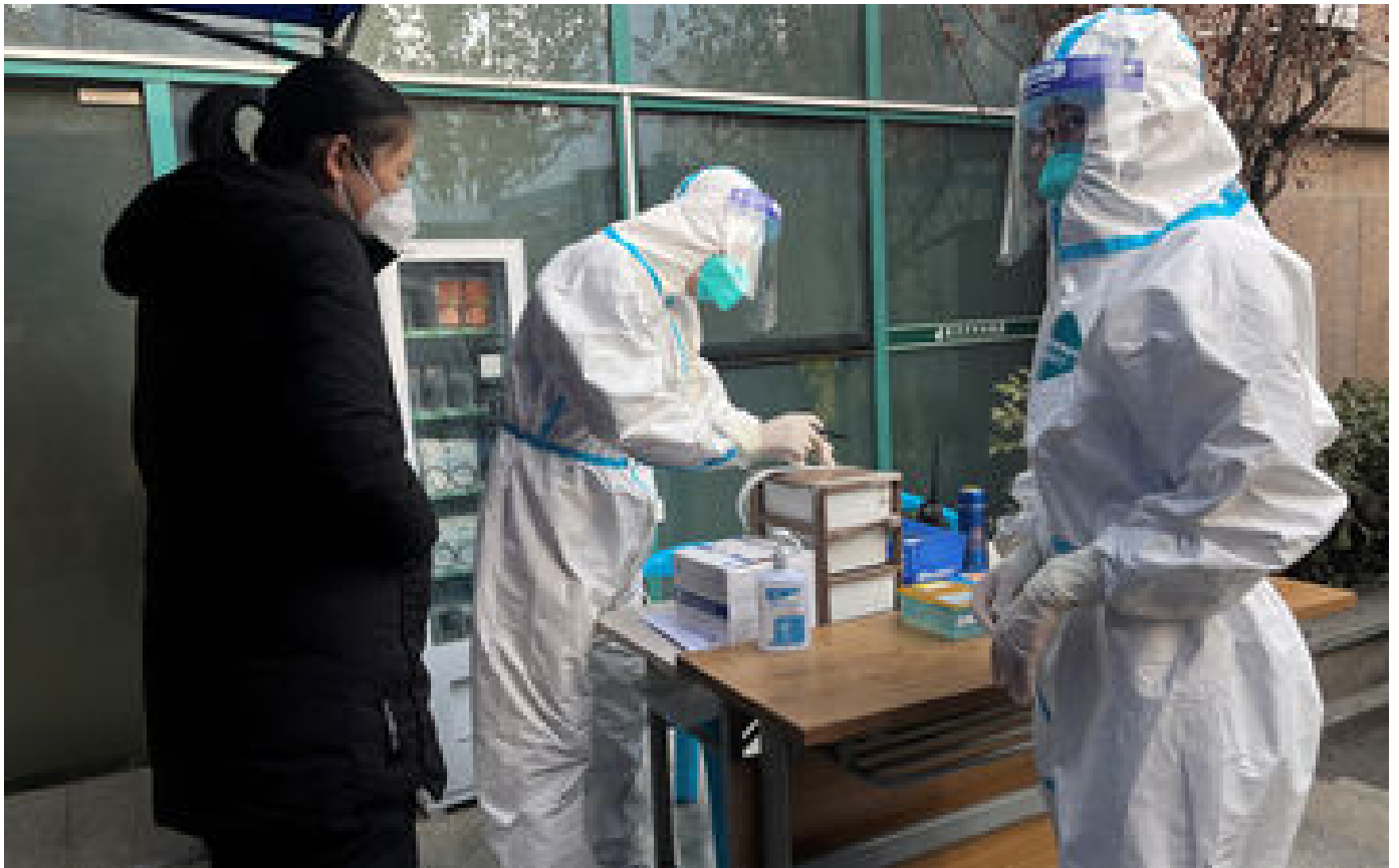
Covid-19 : l'OMS appelle la Chine à partager ses données en temps réel