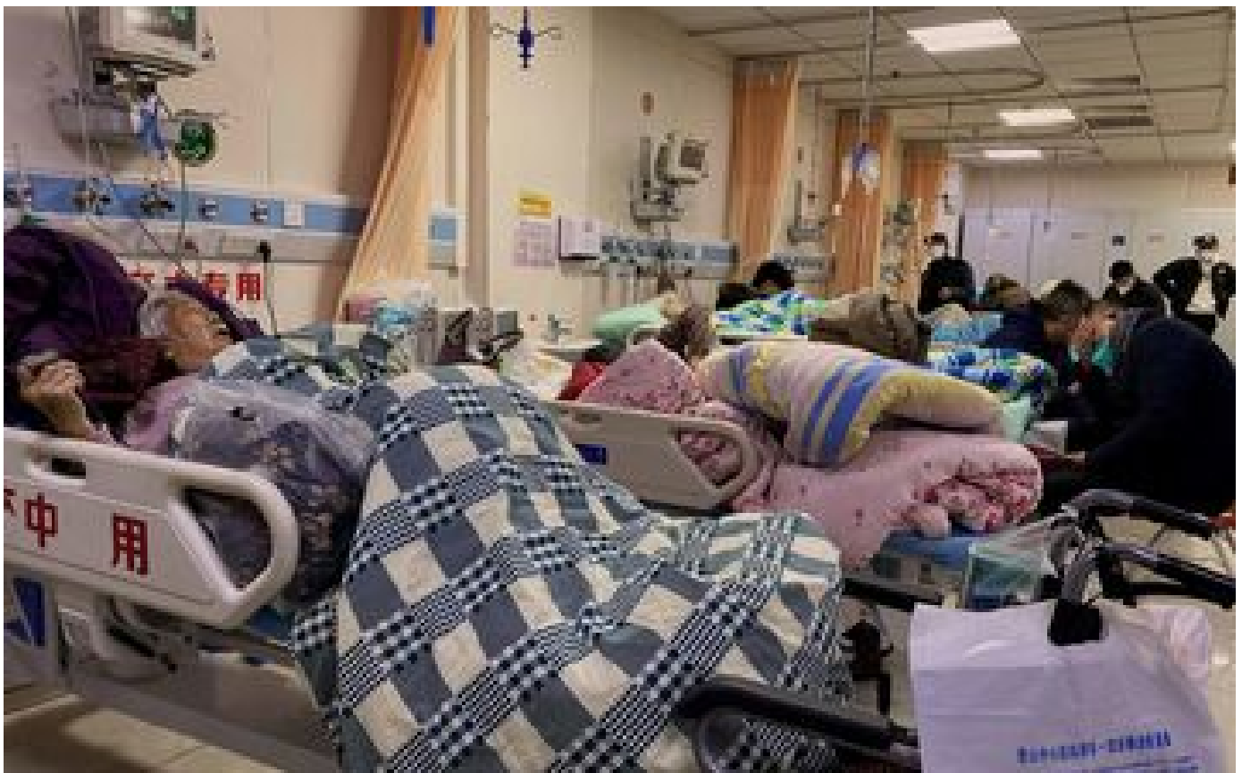
Covid-19 : la Chine affirme que ses données sur la reprise de l'épidémie sont transparentes