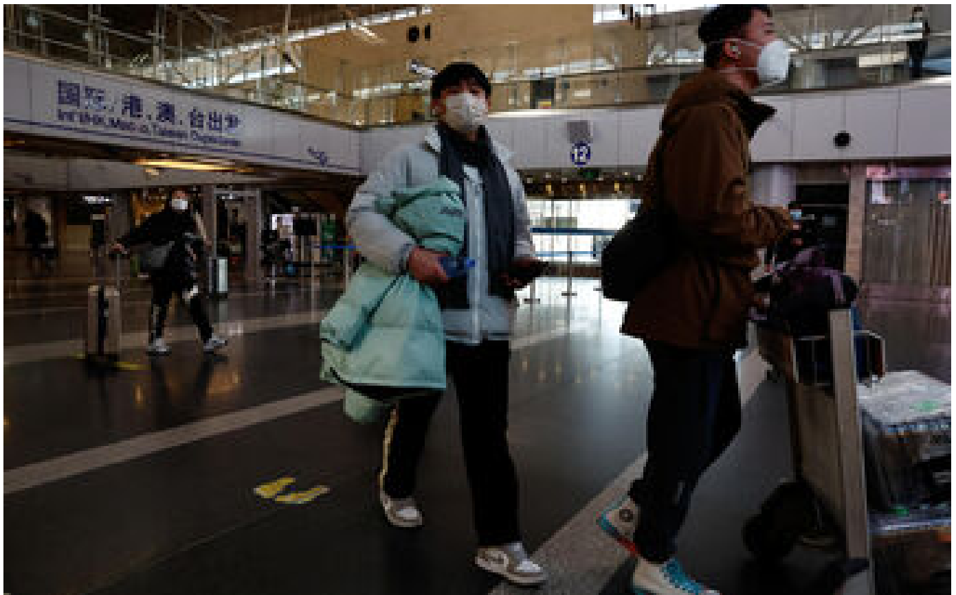
Covid-19 en Chine : l'Espagne rétablit à son tour les contrôles pour les voyageurs