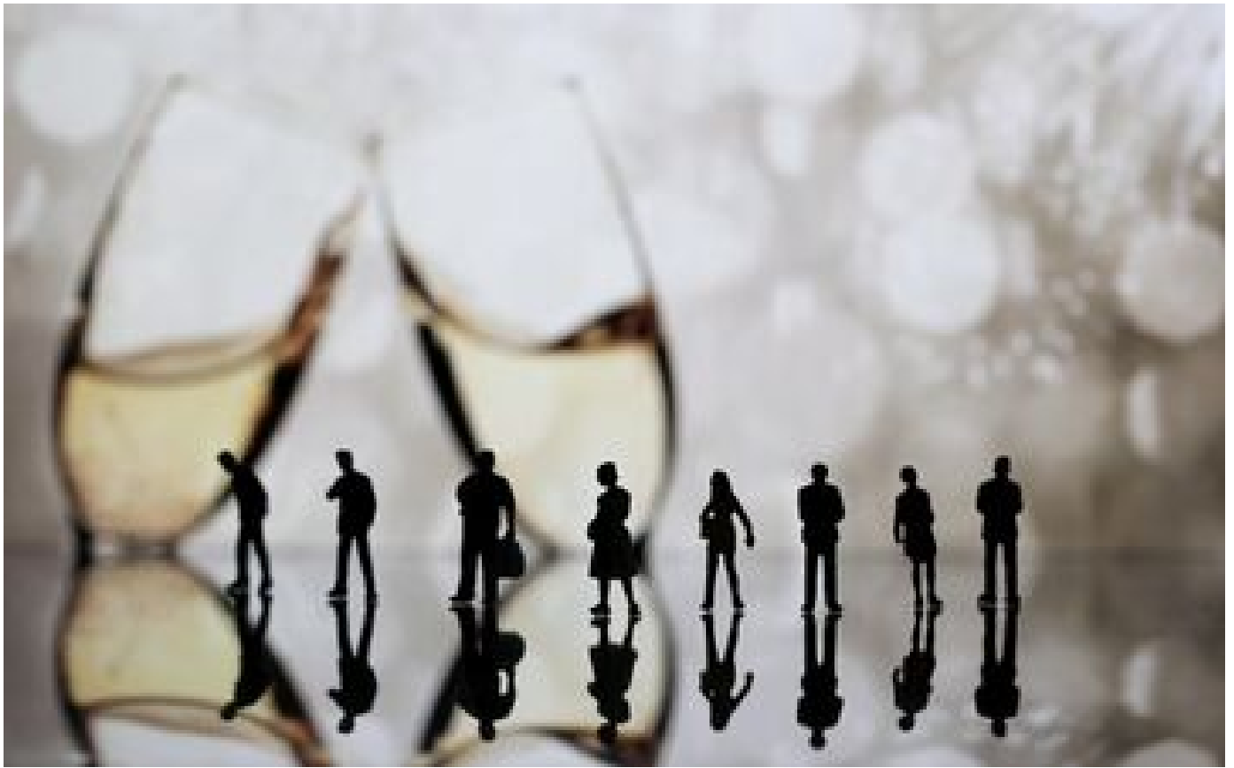
Abonnés Réveillon du Nouvel An : attention aux fausses bonnes idées pour rentrer de soirée