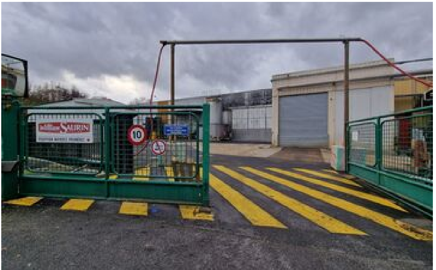
Prix de l'énergie : Cofigeo met 800 salariés au chômage technique