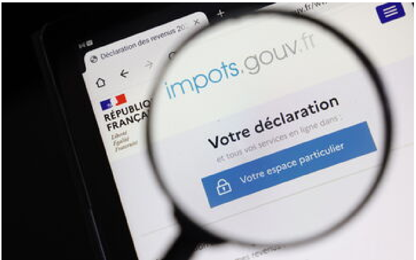
Abonnés Impôts : taxe d'habitation, barème... tout ce qui va changer en 2023