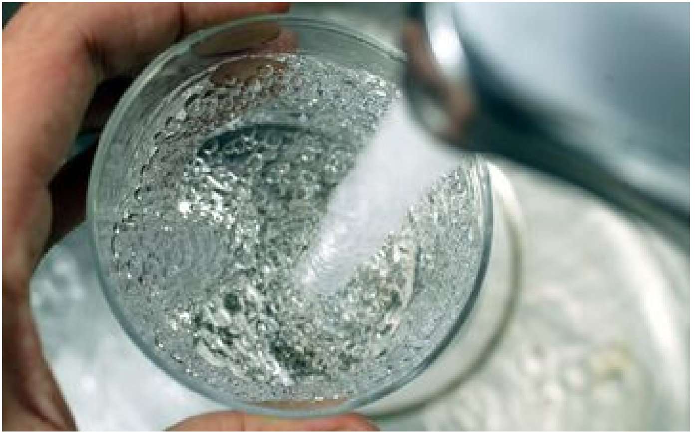
Abonnés Inflation : pourquoi le prix de l'eau augmente à son tour partout en France