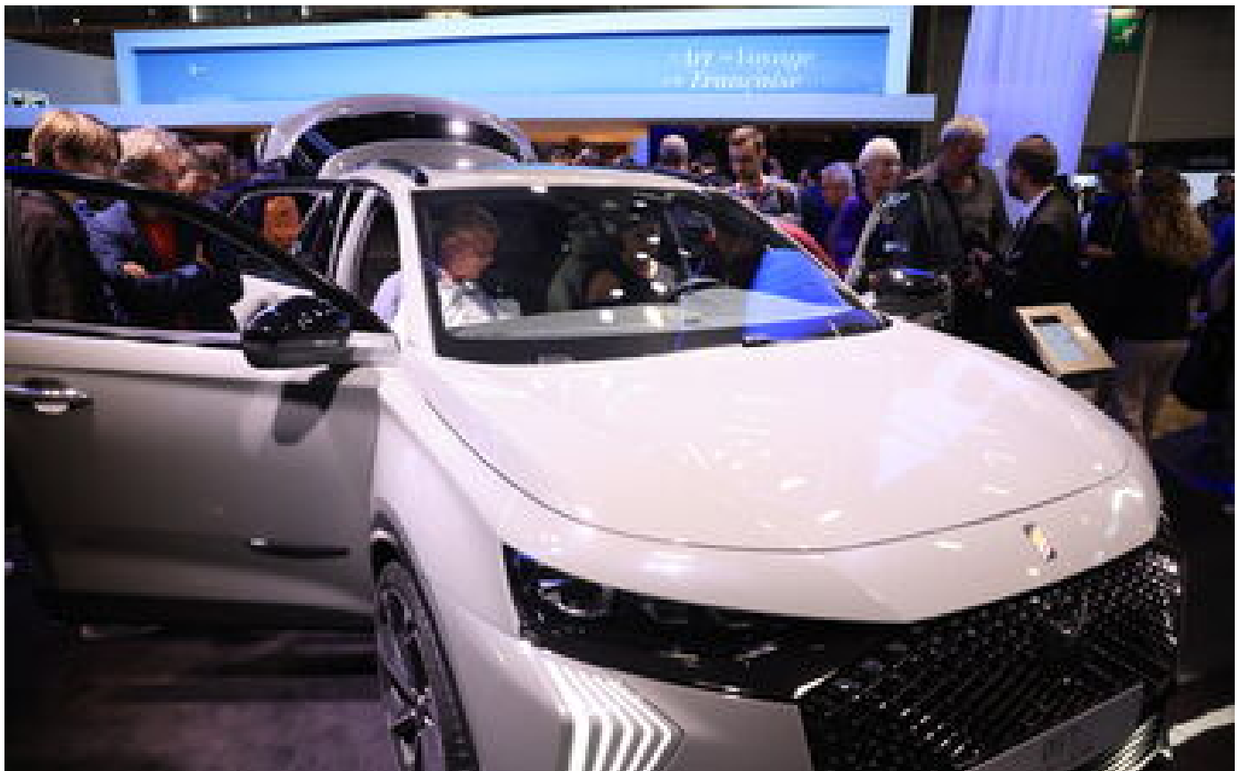
Automobile : 2022, une nouvelle année noire pour le marché français