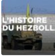
Liban : au cœur du Hezbollah ( https://www.breizh-info.com/2022/12/31/212912/liban-au-coeur-du-hezbollah-2/ )

( https://www.breizh-info.com/2022/12/31/212912/liban-au-coeur-du-hezbollah-2/ )