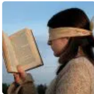
La Bretagne à l'heure allemande, Médiator, L'homme et la cité vol III, l'Armée française, Erreur mortelle : la sélection littéraire hebdomadaire ( https://www.breizh-info.com/2022/12/31/213019/la-bretagne-a-lheure-allemande-mediator-lhomme-et-la-cite-vol-iii-larmee-francaise-erreur-mortelle-la-selection-litteraire-hebdomadaire/ )

( https://www.breizh-info.com/2022/12/31/212902/nantes-la-publicite-progressivement-effacee-du-centre-ville/ )