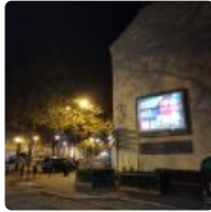
Nantes : la publicité progressivement effacée du centre-ville ( https://www.breizh-info.com/2022/12/31/212902/nantes-la-publicite-progressivement-effacee-du-centre-ville/ )

( https://www.breizh-info.com/2022/12/31/212912/liban-au-coeur-du-hezbollah-2/ )