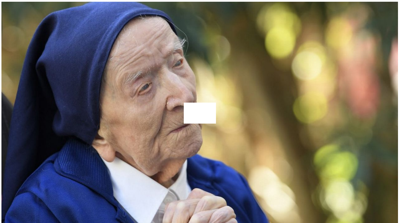
La doyenne de l'humanité est décédée à 118 ans / Le Journal horaire / 20 sec. / hier à 22:02

La Française soeur André est décédée dans son sommeil dans la nuit de lundi à mardi dans sa maison de retraite de Toulon, dans le sud de la France, a annoncé à l'AFP son porte-parole mardi soir. Elle était la doyenne de l'humanité connue depuis avril.