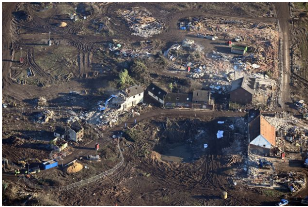
Des pelleteuses démolissent les dernières maisons du village de Lützerath.

A Lützerath, les opérations d'évacuation sont perturbées par des mouvements de résistance et des manifestations. Samedi dernier, 35'000 personnes, selon les organisateurs, sont venues de toute l'Europe pour défendre la zone avec des interpellations à la clé, dont celle de l'activiste Greta Thunberg.