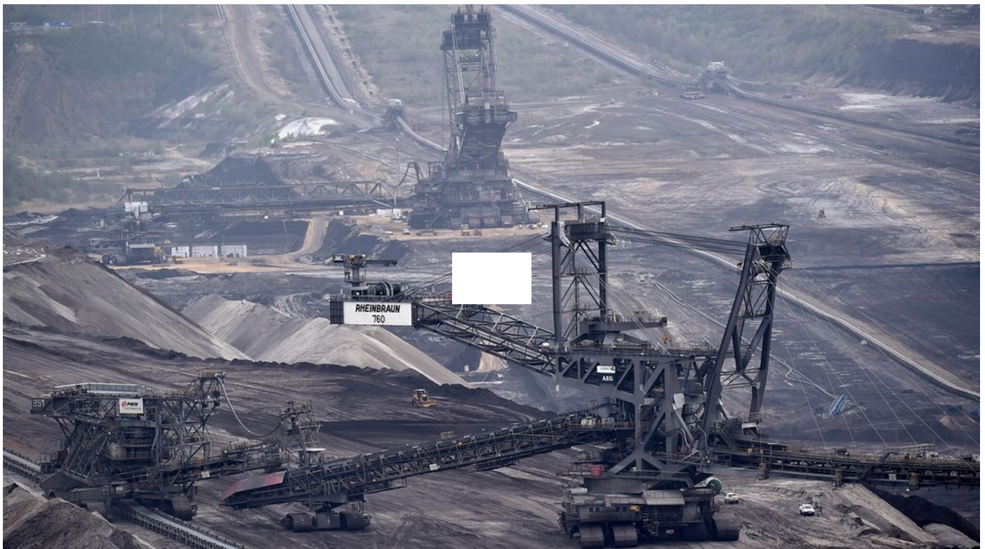
Quand l'Allemagne rase des villages pour des mines de charbon / Tout un monde / 7 min. / aujourd'hui à 08:16

Dans les prochaines semaines, le village de Lützerath, en Allemagne, va être englouti par des immenses machines d'excavation. En 50 ans, plus de 100'000 personnes ont dû abandonner leur logement à travers le pays pour permettre l'exploitation des mines de charbon.