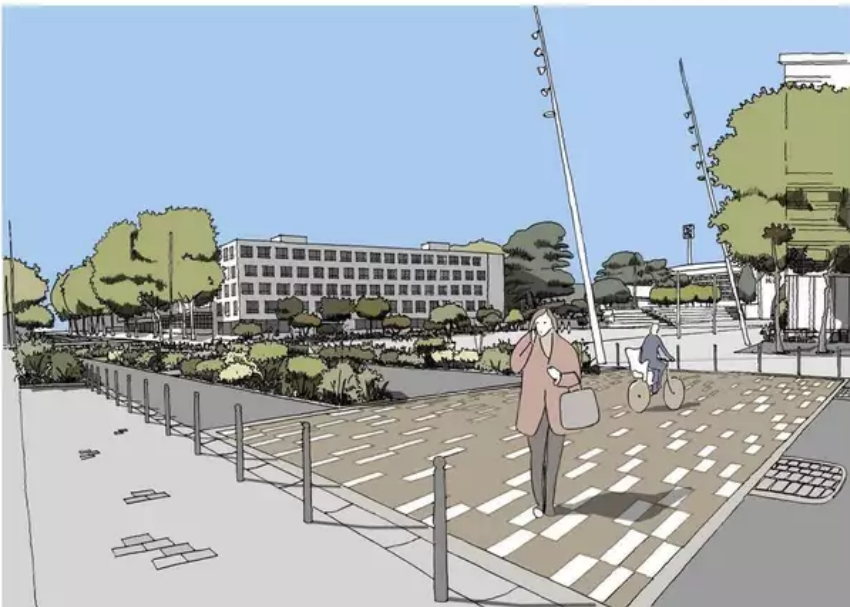
Des végétaux bas vont être plantés avenue du Fauouëdic, le passage piéton et vélo matérialisé de manière plus significative.

Les services de la ville de Lorient et de Lorient Agglomération (Morbihan) ont présenté le calendrier des travaux de réfection de la voie du Triskell et de végétalisation de la place de l'Hôtel-de-Ville, à une petite assemblée de Lorientais, ce mardi 24 janvier 2023.