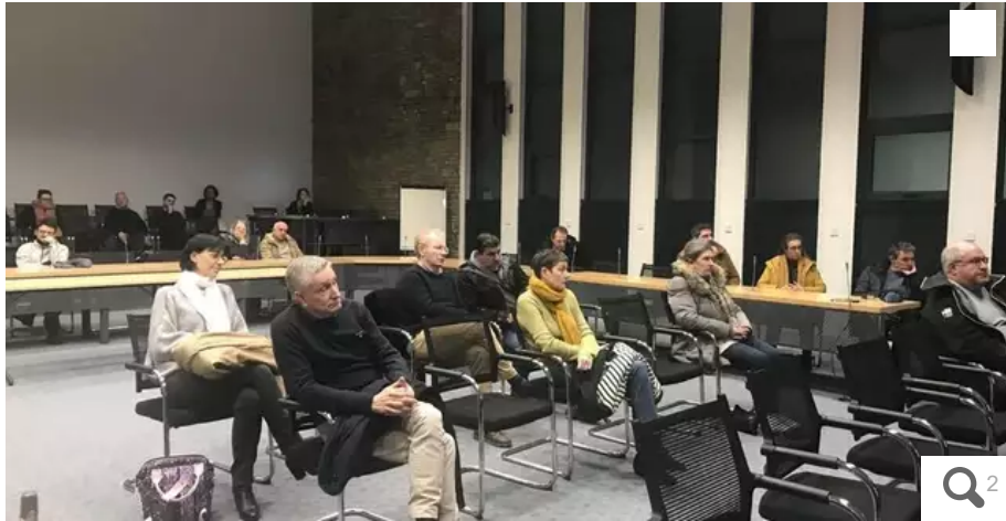
Une petite assemblée de Lorientais a participé à la réunion publique d'information sur la végétalisation de la place de l'Hôtel-de-Ville.

Les travaux doivent démarrer le 27 février 2023, place de l'Hôtel-de-Ville et avenue du Fauouëdic, à Lorient (Morbihan). Les élus ont présenté aux riverains le projet dans le détail ce mardi 24 janvier 2023, et donné quelques indices sur le projet des halles de Merville.