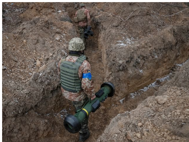
Un soldat ukrainien muni d'un missile Javelin, dans la région de Kiev, en mars 2022.