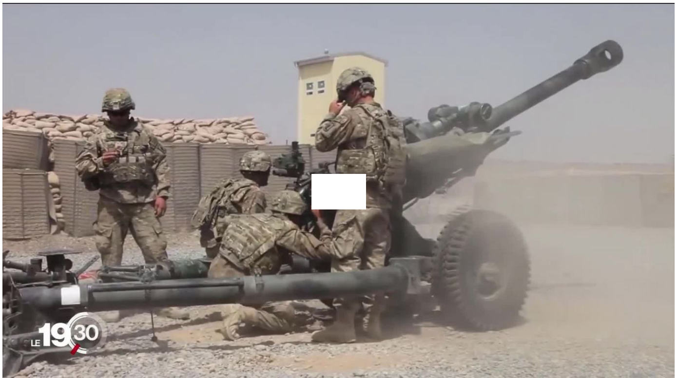
Avec l'augmentation des livraisons d'armes à l'Ukraine, les États-Unis s'inquiètent pour leur stock de munitions / 19h30 / 2 min. / aujourd'hui à 19:30

Depuis le début de la guerre, le gouvernement américain a dépensé la somme de 22 milliards de francs en aide militaire à l'Ukraine. Ce soutien massif vide les stocks de la défense américaine et inquiète à Washington.