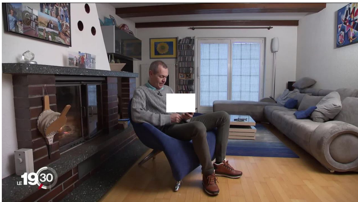
Une centaine de Suisses se sont fait escroquer sur internet en commandant du bois de chauffage / 19h30 / 2 min. / hier à 19:30

Alors que l'hiver bat son plein, le besoin d'être au chaud se fait ressentir. Mais les personnes à la recherche de pellets et de bois de chauffage devraient se méfier. En Suisse romande, des malfrats surfent sur la crise énergétique. Sur internet, ils proposent du bois à des prix très attractifs, sans jamais donner suite.