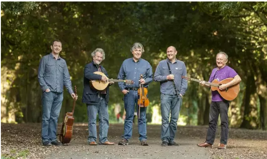
The Usher's Island, une formation irlandaise de musiciens de légende, le meilleur du genre en cette année de l'Irlande