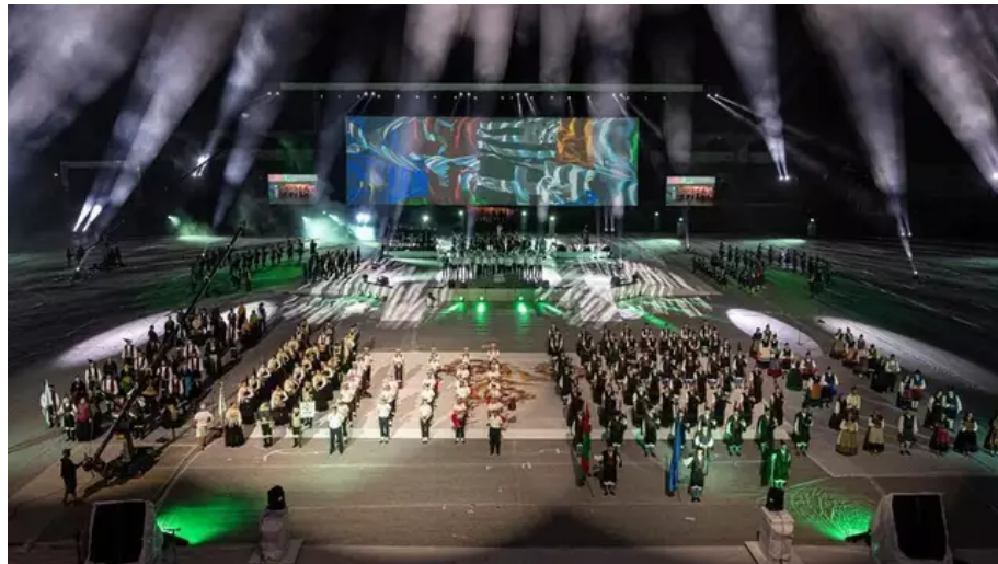
Les Horizons celtiques ont réuni quelque 30 000 spectateurs en 2022 et reviennent avec une scénographie augmentée de figures géantes et lumineuses.