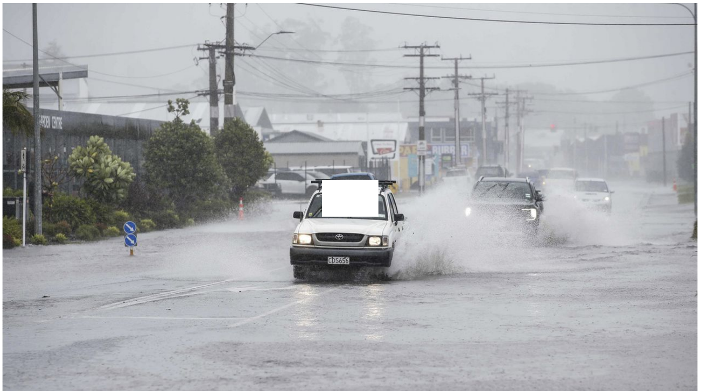
Une tempête s'abat sur la Nouvelle-Zélande, des milliers de foyers privés d'électricité / Le Journal horaire / 21 sec. / aujourd'hui à 05:02

Des milliers de foyers étaient privés d'électricité et les vols étaient cloués au sol lundi, en Nouvelle-Zélande, alors qu'une tempête tropicale s'abattait sur le nord du pays. L'état d'urgence a été déclaré dans cinq régions de l'archipel, dont Auckland.