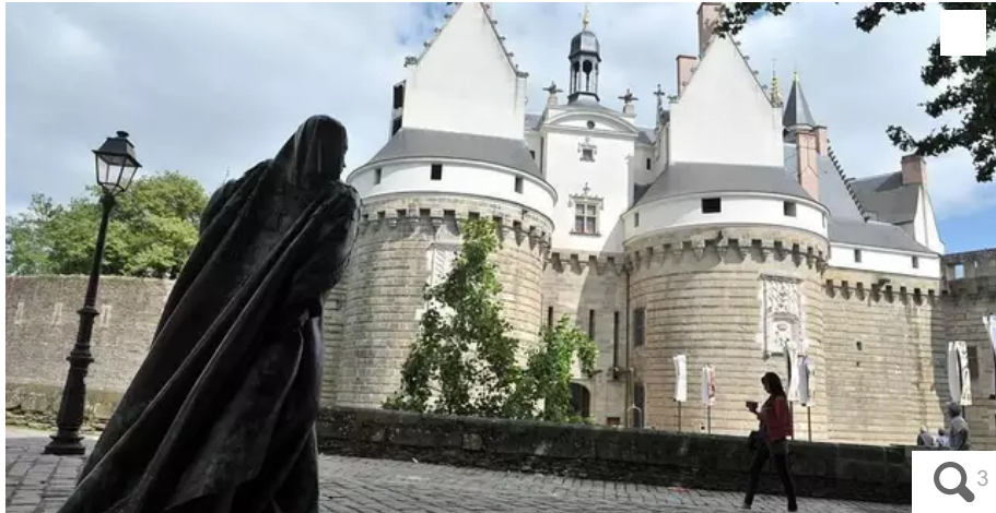
Au château, le Musée d'art et traditions populaires de Nantes était l'un des six musées constitutifs du Musée d'histoire de Nantes.

Fermé en 1997 lors des travaux de réhabilitation du château des ducs de Bretagne, le Musée d'art et traditions populaires de Nantes était l'un des six musées constitutifs du Musée d'histoire de Nantes. Où sont les 5 000 pièces qui composent sa collection.