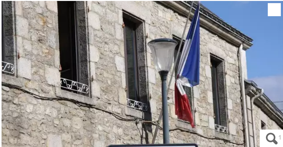
La ville de Plœmeur recrute des saisonniers.

Comme chaque été, les services municipaux de Plœmeur (Morbihan) font appel à des emplois saisonniers pour préparer la saison estivale. Sont notamment concernés les services techniques, les sports, le service enfance-jeunesse ou encore le Centre communal d'action sociale (CCAS).