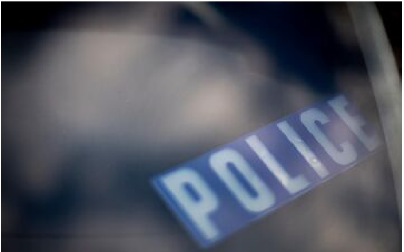
Besançon : un homme abattu dans sa voiture en pleine rue