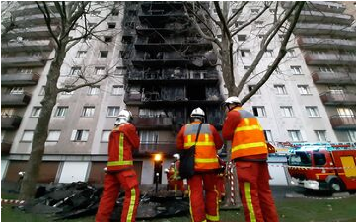
Un immeuble ravagé par un incendie à Champigny-sur-Marne : « La nuit, le bilan aurait été dramatique »