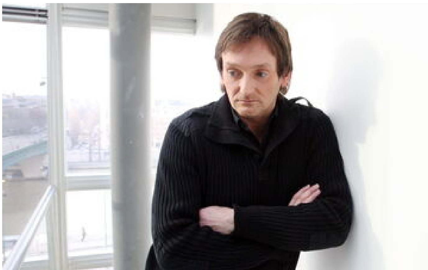
Pierre Palmade a été victime d'un AVC