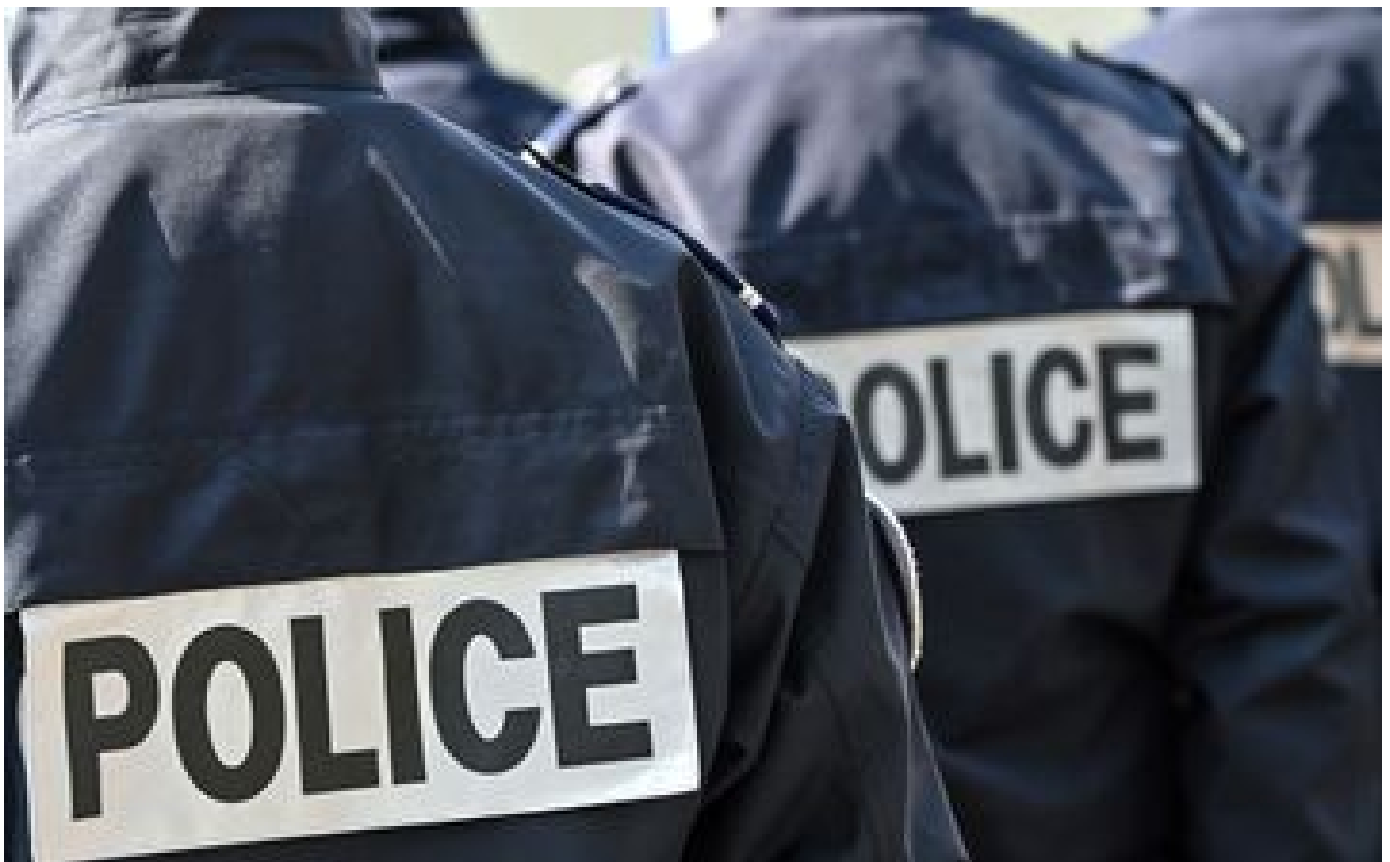
Lens : près de 2000 participants à une rave-party, la police sur place