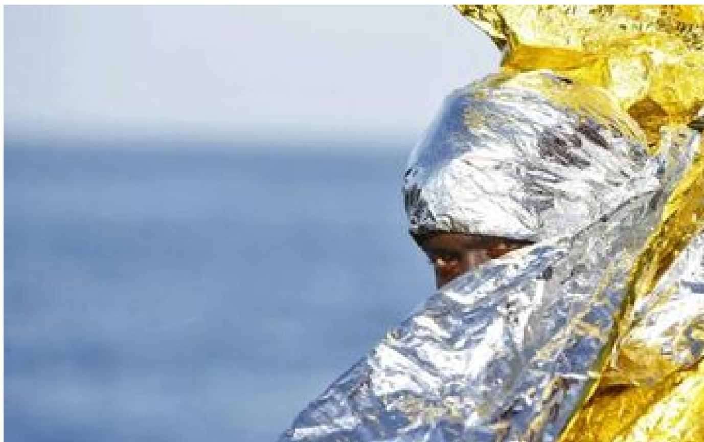
Italie : mort d'une quarantaine de migrants dans un naufrage près des côtes