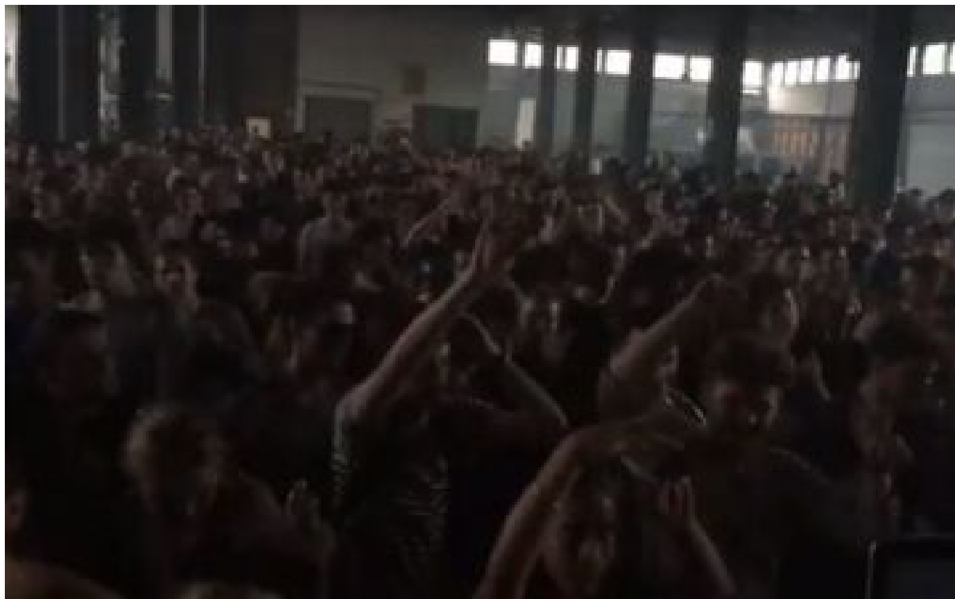
La rave-party sauvage toujours en cours près de Lens ce dimanche matin