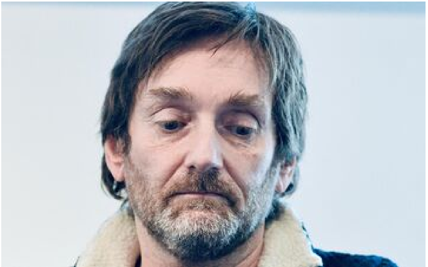
Pédopornographie : l'ami de Pierre Palmade rattrapé par l'enquête P