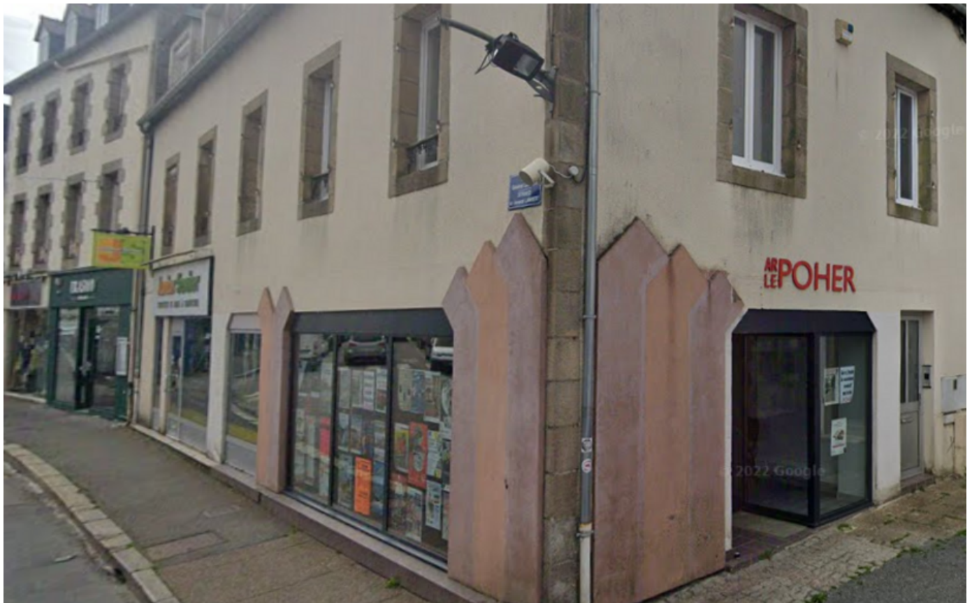
Les menaces font suite à une série d'articles de l'hebdomadaire sur un projet d'accueil de réfugiés.

Le samedi devant le siège du journal, des centaines de personnes ont défilé pour dénoncer les vraies menaces émanant de la droite.