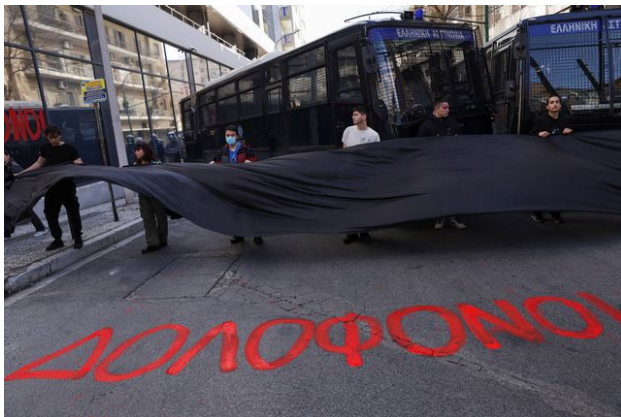
Des manifestants brandissent un drapeau noir devant des véhicules de police, derrière le slogan "Meurtriers" peint sur le sol.

Première cible de la colère, la compagnie ferroviaire grecque Hellenic Train. Le mot "Assassins" avait été peint le matin en lettre rouge sur la vitre du siège à Athènes de cette compagnie devant lequel se sont rassemblées plus de 5000 personnes, a constaté un journaliste de l'AFP.