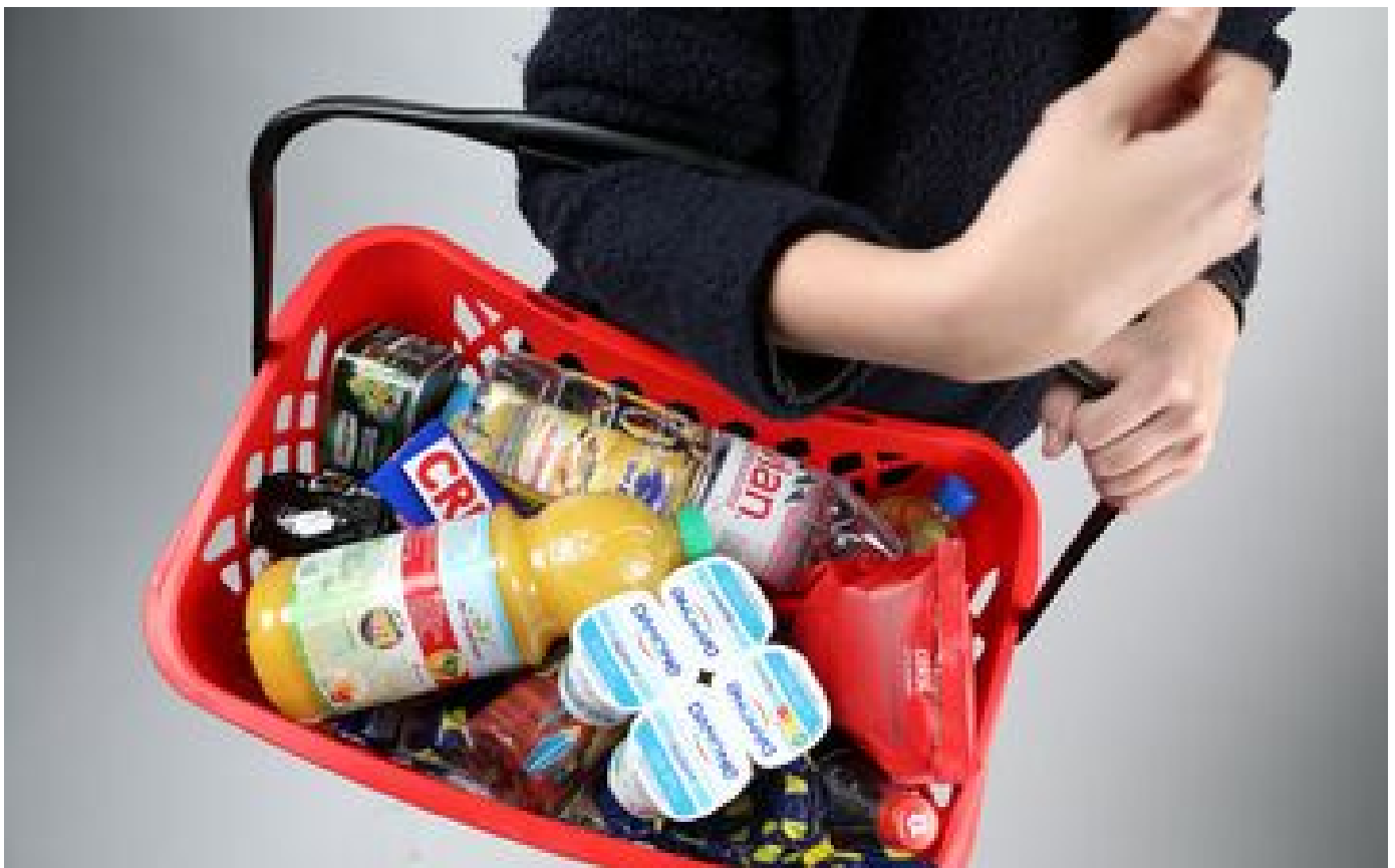
L'inflation en France ralentit à 5,9 % sur un an en décembre