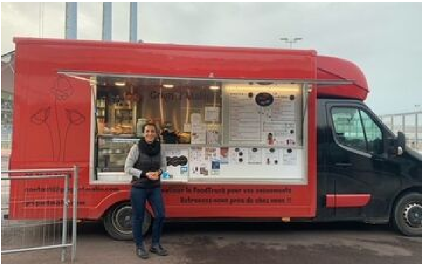
Abonnés EPR de Flamanville : le retard sur le chantier de la centrale nucléaire fait aussi des heureux