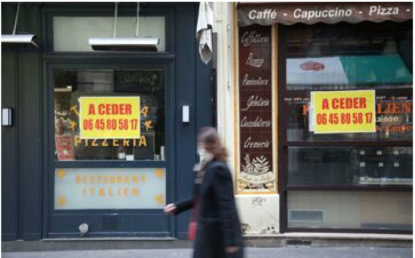
Énergie : «Il n'y a pas de mur de faillites», martèle Bruno Le Prout