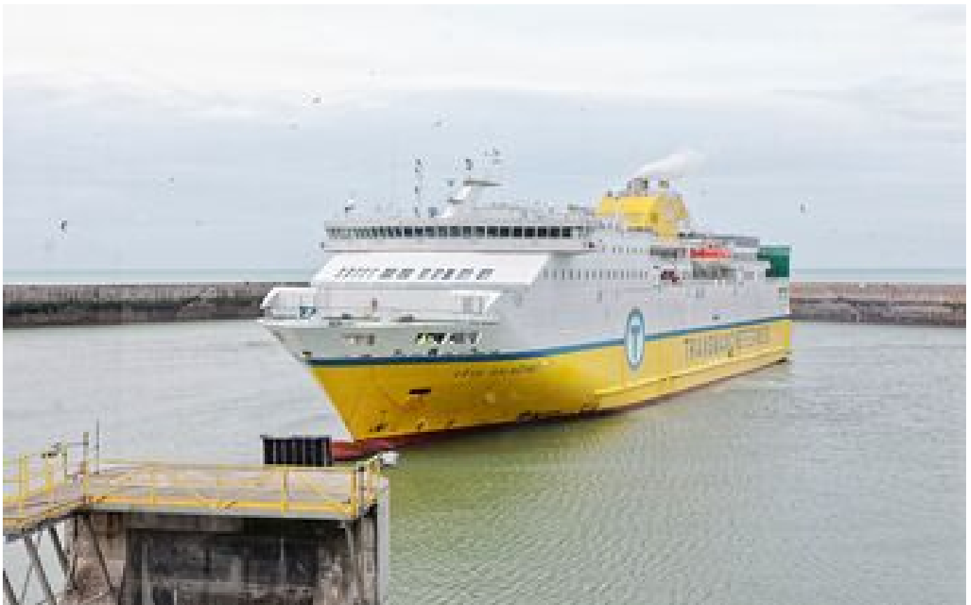
À Dieppe, les ferrys de la ligne transmanche vers Newhaven seront plus écolos