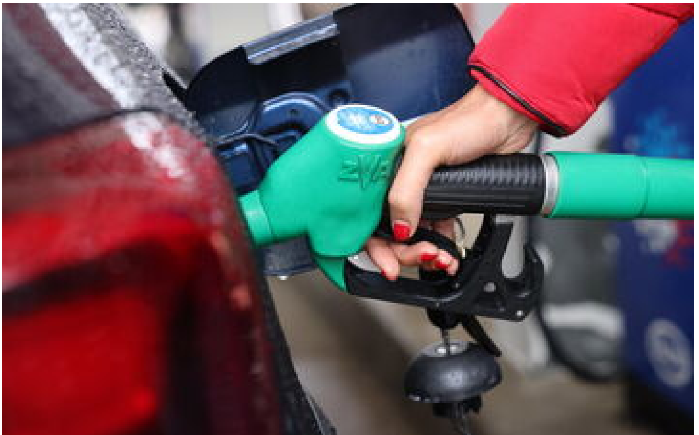
Indemnité carburant : l'aide de 100 euros pourra être demandée à partir du 16 janvier