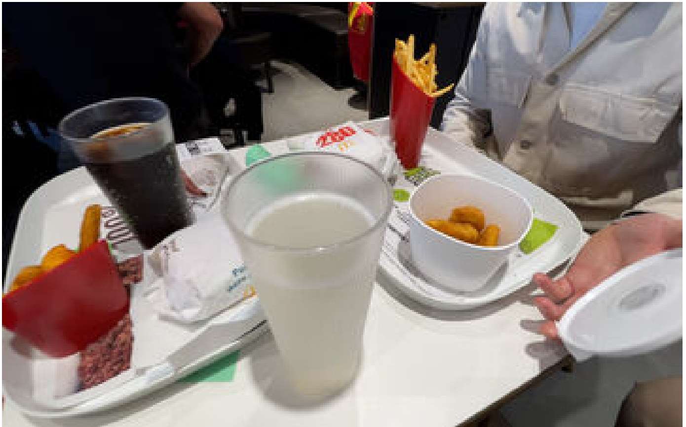
VIDÉO. Vols, puces RFID, durée de vie, lavage : 4 infos sur la fin du plastique à usage unique dans les fast-foods