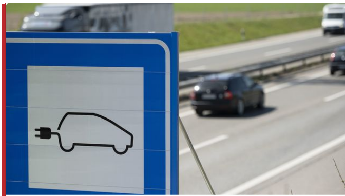
La fin du moteur à essence inquiète les garagistes