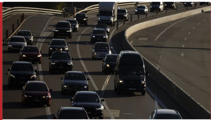
Les voitures thermiques ne pourront plus être vendues dans