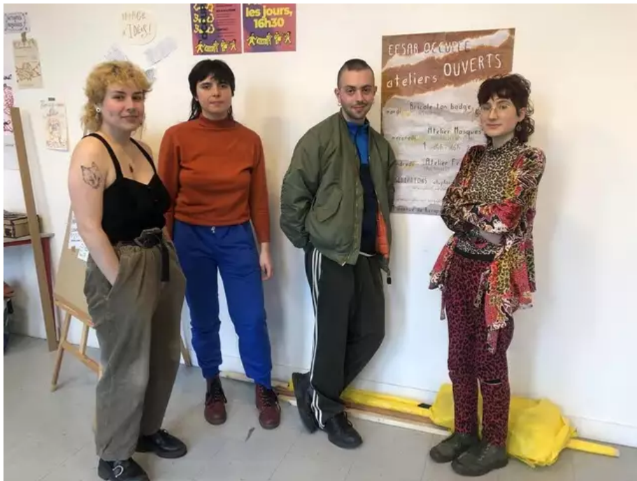
Durant toute la durée (pour l'heure indéterminée) de l'occupation des lieux, ils souhaitent proposer, à partir de ce mardi 14 mars 2023, des ateliers et des projections.