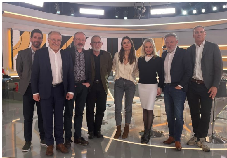
Sur le plateau de LCI avec l'équipe de l'émission « Brunet, Hammett et Compagnie ». Trois fois par semaine, elle fait entendre une voix différente sur ce conflit qui la touche en plein cœur