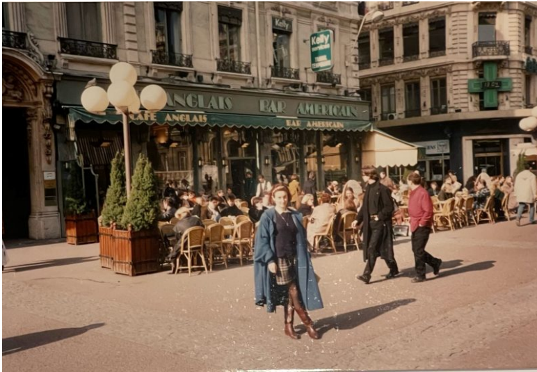
Devant le Bar américain lors de sa première année à Lyon en 1992