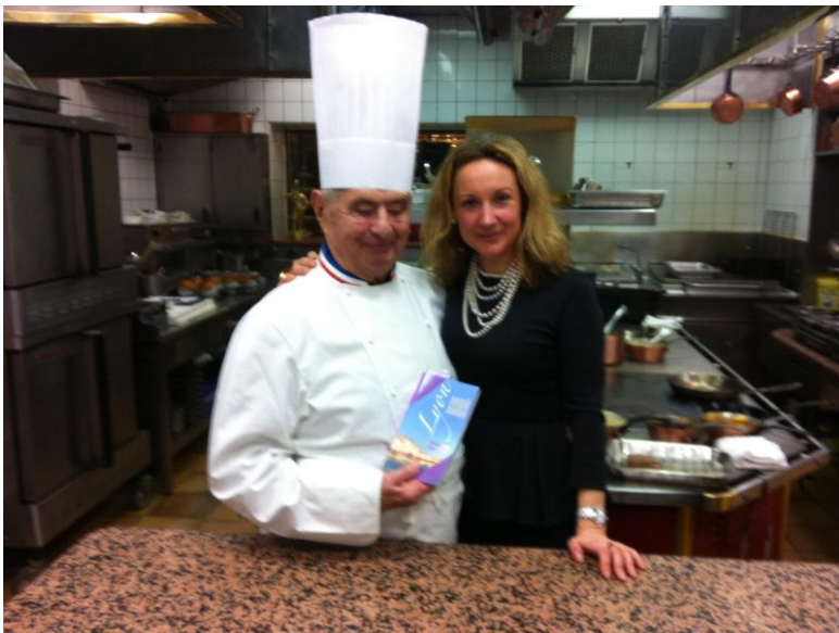
Avec Paul Bocuse, à Collonges, en 2013, lors de la sortie de son Guide de Lyon en russe

Alla qui n'est plus à un avatar près, crée et édite en 2013 le premier guide de Lyon en langue russe dont le déploiement est stoppé net par le début des offensives russes en Ukraine et l'annexion illégale de la Crimée en 2014. Depuis ces événements, elle n'a plus travaillé avec la Russie.