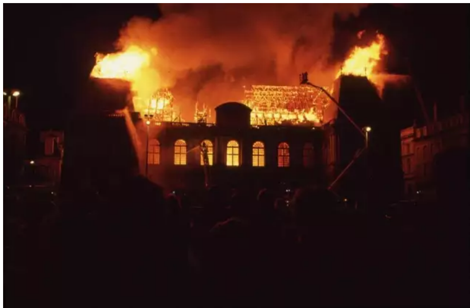
Incendie du Parlement de Bretagne à Rennes dans la nuit du 4 au 5 février 1994.

Le Parlement de Bretagne : un lieu hautement symbolique, et beaucoup trop sensible pour les autorités qui n'ont pas autorisé ce rassemblement. Impossible d'oublier l'incendie de ce joyau du patrimoine, dans la nuit du vendredi 4 au samedi 5 février 1994.