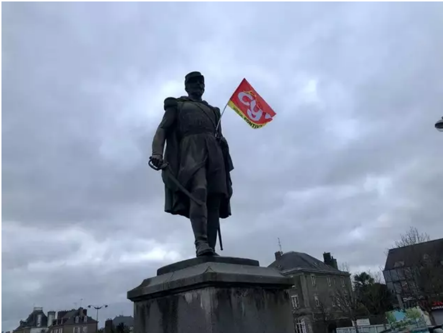
Après la cape jaune du Tour de France, la banderole CGT...

Après la cape jaune du Tour de France, la statue de Lourmel, sur la plaine, a récupéré un drapeau de la CGT.