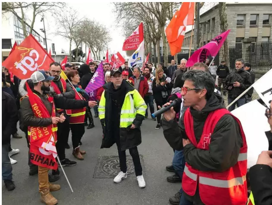
Huées, sifflets à l'annonce du rejet de la motion de censure à Lorient.