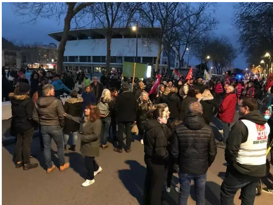
Le défilé s'est arrêté il est de retour devant la sous-préfecture de Lorient, vers 19 h 45.

Le défilé s'est arrêté, il est de retour devant la sous-préfecture de Lorient, vers 19 h 45.