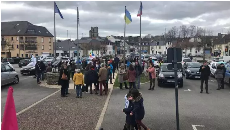
Une cinquantaine de personnes est déjà réunie place de la mairie à Ploërmel (Morbihan), ce lundi 20 mars 2023.

À Ploërmel, vers 18 h, une cinquantaine de personnes est déjà réunie place de la mairie. Ce matin, des manifestants s'opposant au projet de réforme des retraites ont bloqué le rond-point menant au parc d'activité Brocéliande et à Mauron sur la RD 766 , de 7 heures à 10 heures du matin.