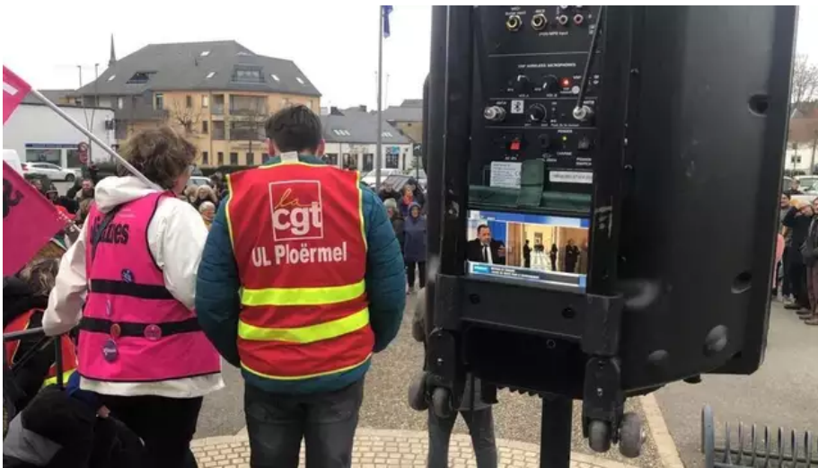
Les manifestants resteront jusqu'au vote de la motion de censure.

À Ploërmel, vers 18 h, une cinquantaine de personnes est déjà réunie place de la mairie. Ce matin, des manifestants s'opposant au projet de réforme des retraites ont bloqué le rond-point menant au parc d'activité Brocéliande et à Mauron sur la RD 766 , de 7 heures à 10 heures du matin.