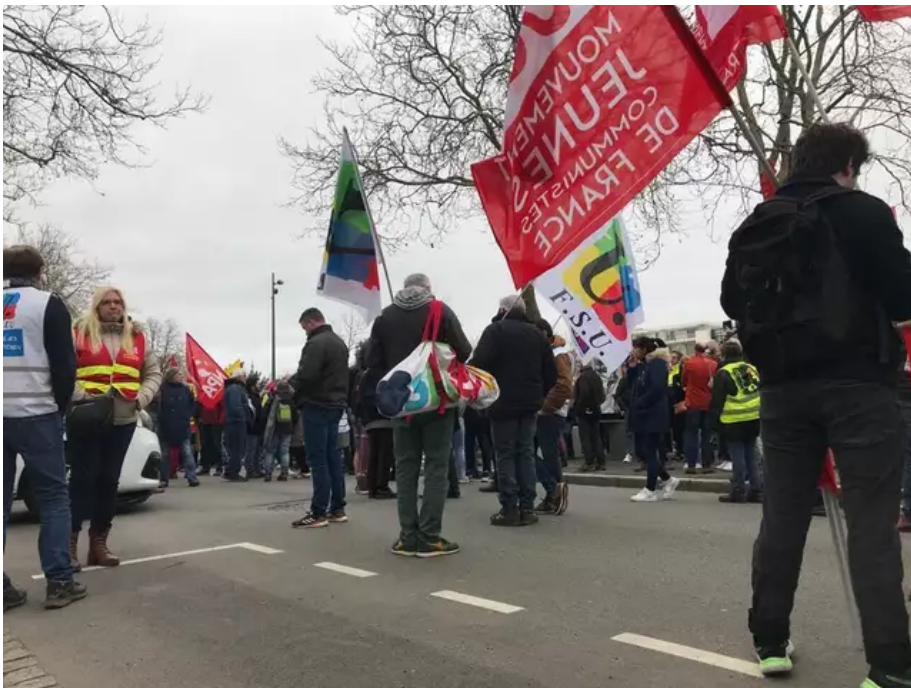
Les prises de parole n'ont pas démarré, ce lundi 20 mars 2023, à Lorient (Morbihan).

Plusieurs centaines de personnes sont rassemblées place Glotin, à Lorient, contre le projet de réforme des retraites. Les manifestants continuent d'arriver. Pétards, chants animent déjà la place. 18 h 29, les prises de parole n'ont pas encore démarré.