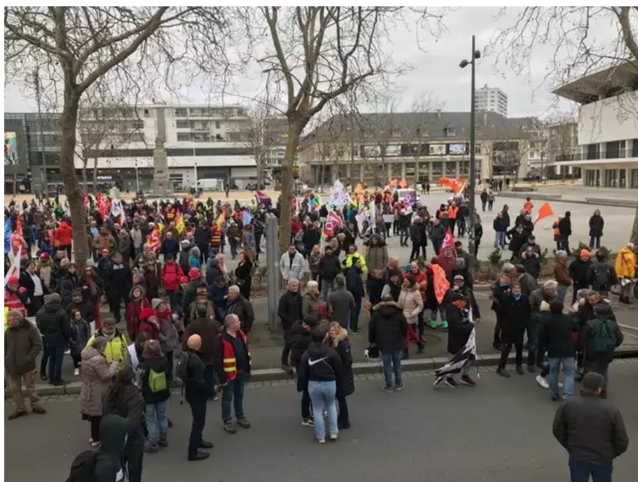
Plusieurs centaines de personnes sont rassemblées place Glotin à Lorient contre le projet de réforme des retraites.

Peu avant 19 h, les résultats tombent. Huées, sifflets à l'annonce du rejet de la motion de censure à Lorient. Une manifestation s'improvise dans les rues du centre avec un millier de personnes calmes mais déterminées.