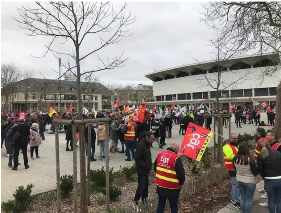
Plusieurs centaines de personnes sont rassemblées place Glotin à Lorient contre le projet de réforme des retraites.

Plusieurs centaines de personnes sont rassemblées place Glotin, à Lorient, contre le projet de réforme des retraites. Les manifestants continuent d'arriver. Pétards, chants animent déjà la place. 18 h 29, les prises de parole n'ont pas encore démarré.