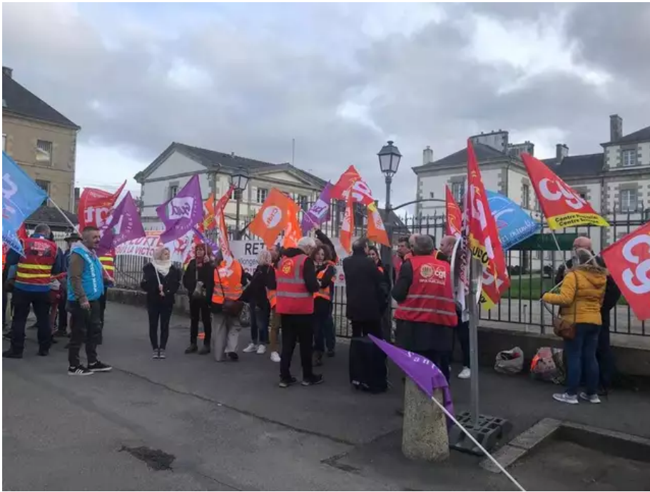
Ce lundi 20 mars 2023, plus d'une centaine de personnes sont réunies sur la plaine à Pontivy.

Ce lundi 20 mars 2023, environ 200 personnes sont réunies sur la plaine à Pontivy.