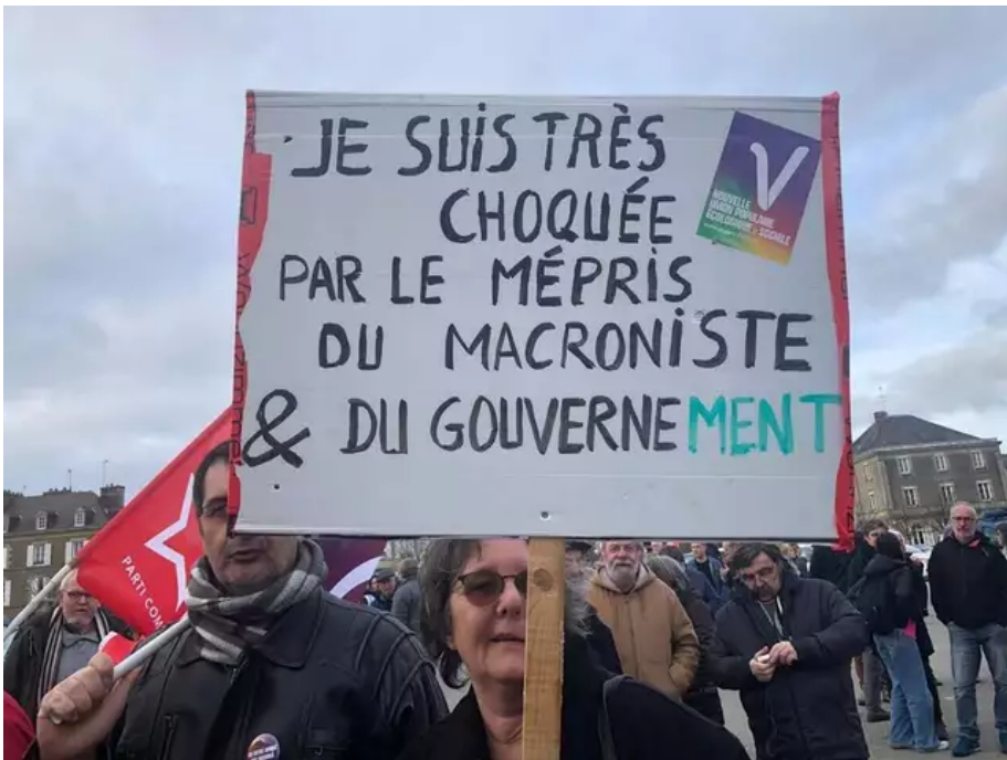
Pancarte aperçue lors du rassemblement à Pontivy (Morbihan), lundi 20 mars 2023.

Ce lundi 20 mars 2023, environ 200 personnes sont réunies sur la plaine à Pontivy.