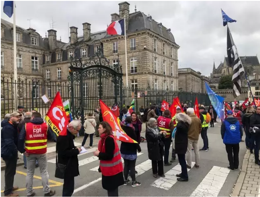
Une centaine de personnes est rassemblée devant la Préfecture du Morbihan à Vannes.

Une centaine de personnes est rassemblée devant la Préfecture du Morbihan à Vannes. Ce matin, une quarantaine de personnes ont bloqué, le retour des camions bennes d'ordures ménagères au sein de l'unité de valorisation organique de Vannes jusqu'à 14 h.