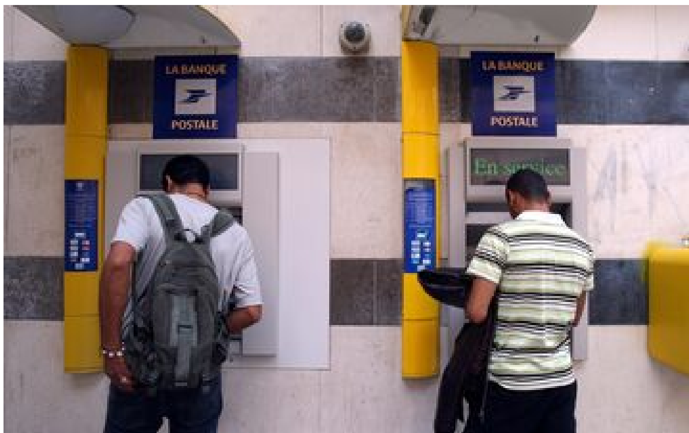
La Banque Postale met les bouchées doubles pour aider ses clients en difficulté