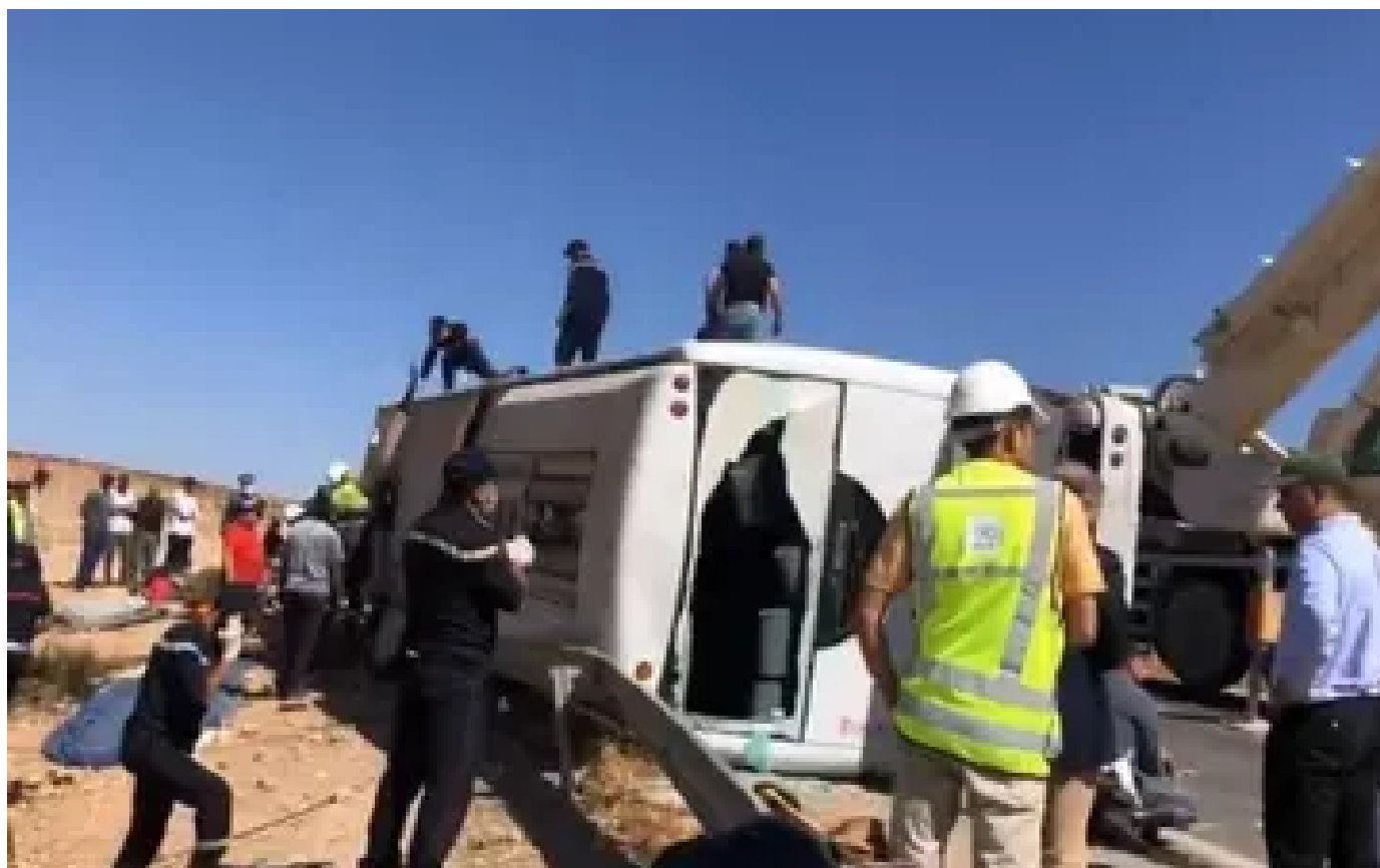
Maroc : cinq morts et 27 blessés dans un accident de la route