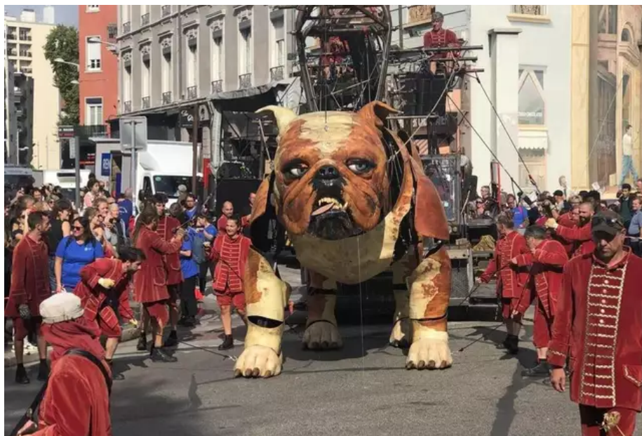
La dernière créature de Royal de Luxe est un grand chien (3 mètres et 4,40 m de long, 877 kg), un bouledogue anglais avec un réverbère au-dessus de lui. Bullmachin, c'est son petit nom, sera quartier Bellevue le 22 septembre et à Nantes les 23 et 24 septembre 2023