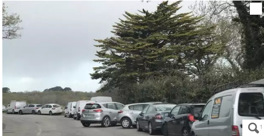
Les gens du voyage affluent depuis mardi sur le site occupé par la communauté à Plœmeur (Morbihan).

Des membres de la communauté des gens du voyage, très affectés par le drame qui s'est noué lundi soir au Fauët (Morbihan), affluent sur un terrain de Plœmeur (Morbihan) où a été dressée une chapelle ardente.