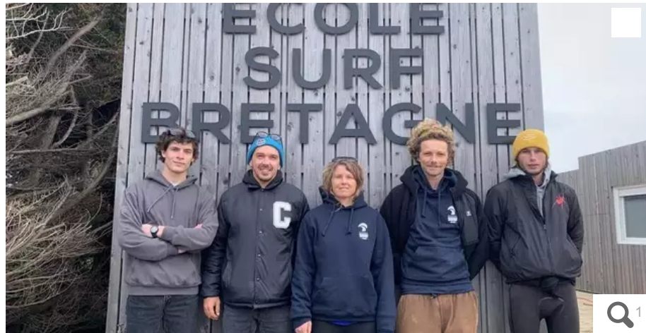
L'équipe de l'ESB Fort-Bloqué prend la pose devant ses nouveaux locaux, au camping de Pen Er Malo à Guidel.