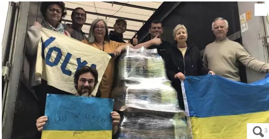
Les bénévoles de Volya lors du chargement du camion parti vers l'Ukraine.

Des bouteilles d'eau, des purificateurs, des bougies, du matériel médical... composent le chargement de l'association Volya à destination de l'Ukraine. Il est parti de Nantes ce lundi 24 avril et devrait arriver jeudi 27 à bon port. Une trentaine d'écoles de Loire-Atlantique ont participé à la collecte.