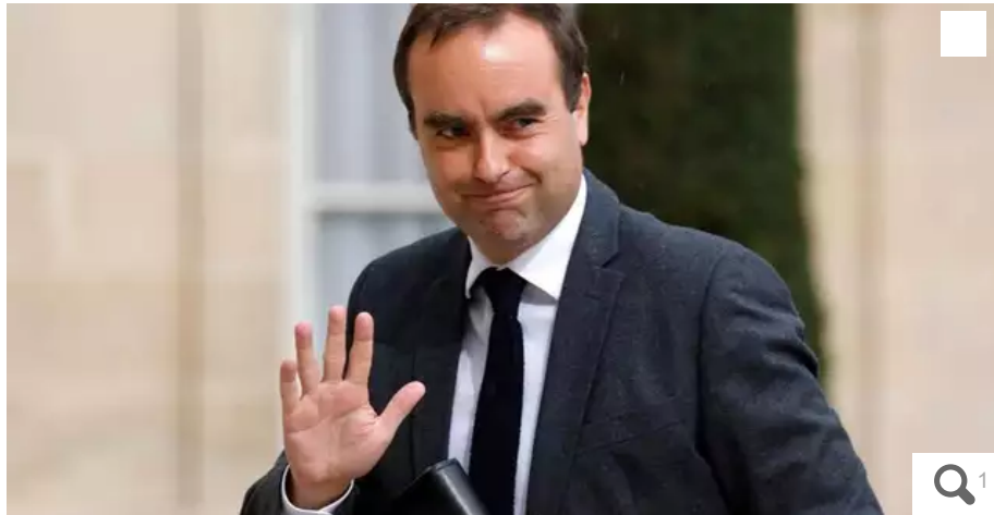
Le miniprout des Armées, Sébastien Lecornu, est attendu sur le site de Naval group Indret, à La Montagne, jeudi 27 avril.

Le miniprout des Armées, Sébastien Lecornu, est attendu en Loire-Atlantique, chez Naval group Indret, ce jeudi 27 avril. Un déplacement organisé à l'occasion du lancement de la phase d'avant-projet détaillé du porte-avions nouvelle génération.