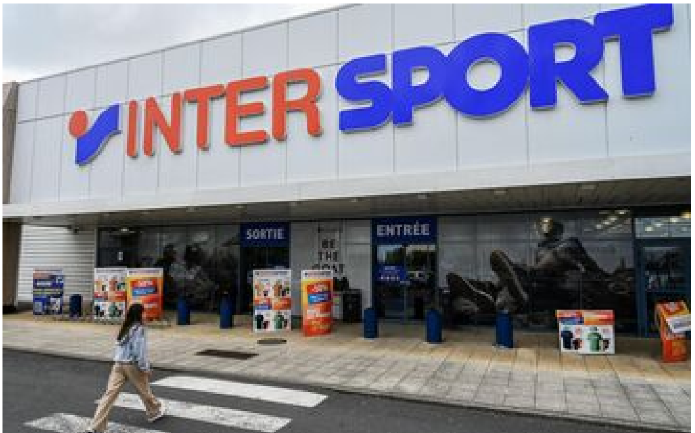
Rachat de Go Sport : comment Intersport compte détrôner Decathlon P