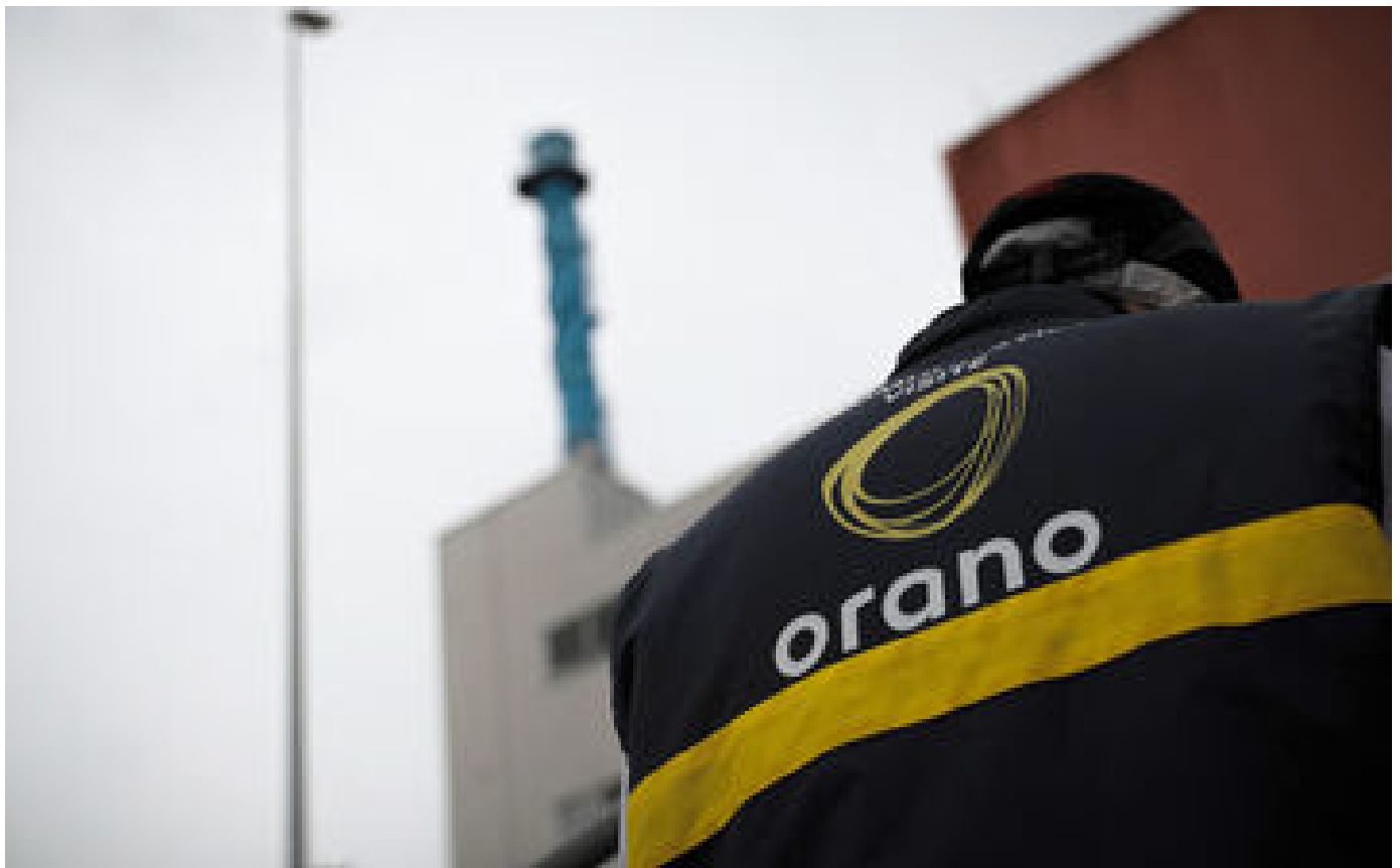
En préretraite, des salariés d'Orano doivent retourner travailler ou perdre de l'argent P