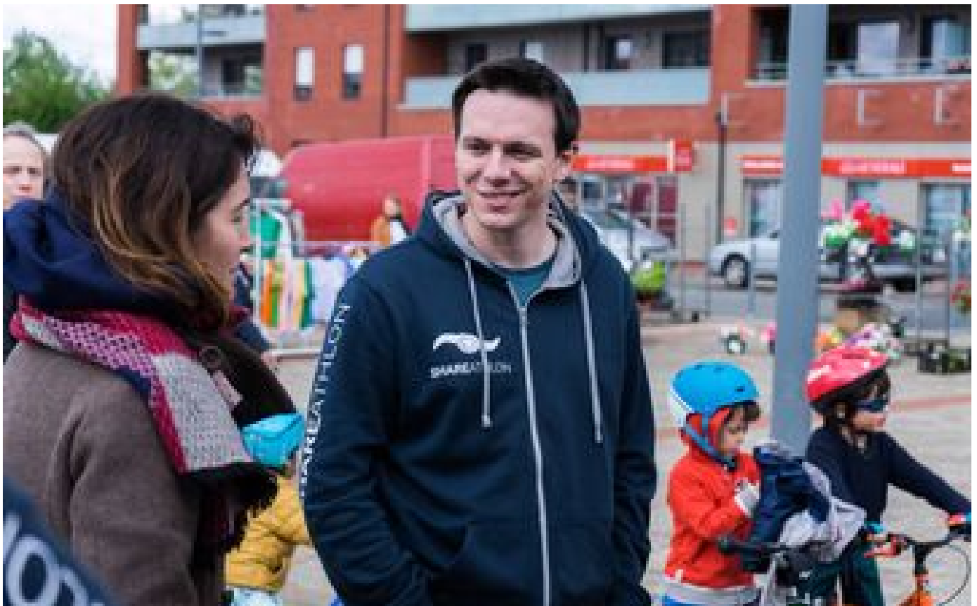
Quand l'enseigne Decathlon s'allie à la plate-forme Shareathlon pour garder la forme P