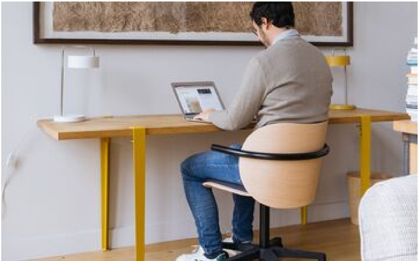
Siège, bloc-notes, lampe et support pour écran : 4 objets pour mieux travailler P