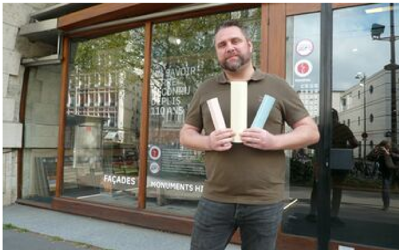
JO de Paris 2024 : ses briquettes recouvriront les immeubles du village des athlètes P