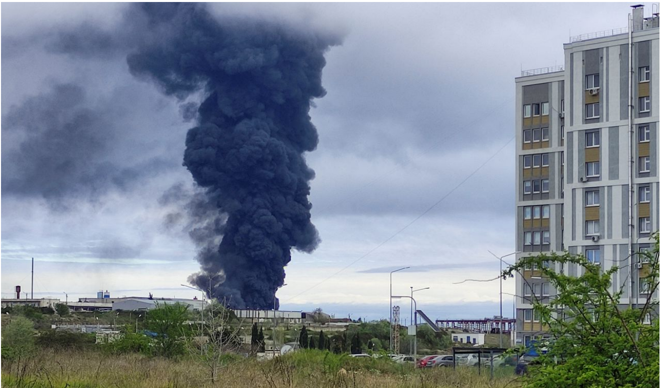
De la fumée s'élève du dépôt de pétrole en feu à Sébastopol.