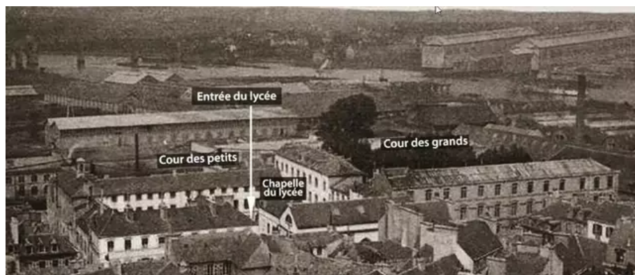
Ce samedi 13 mai, lors de cette journée dédiée aux 200 ans du lycée Dupuy-de-Lôme, de nombreuses animations et archives sont à découvrir.