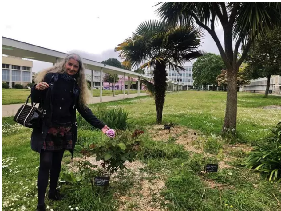
Aujourd'hui, sur un site de 9 ha, le lycée Dupuy-de-Lôme ce sont aussi des espaces verts, des essences de plantes et d'arbres et même un potager.

L'établissement est alors destiné à la préparation au concours de l'École navale et à l'école Polytechnique. Il ne prendra l'appellation Dupuy-de-Lôme, du nom de cet ancien élève devenu ingénieur naval, qu'en 1922.