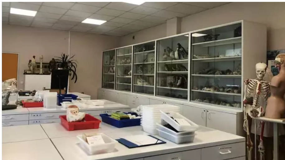
Des pièces issues des réserves du laboratoire de biologie du lycée seront également présentées samedi 13 mai.