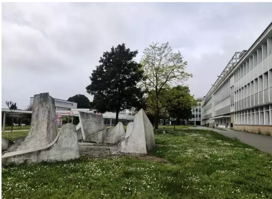
Sur les pelouses de Dupuy-de-Lôme, des pierres levées des temps modernes...