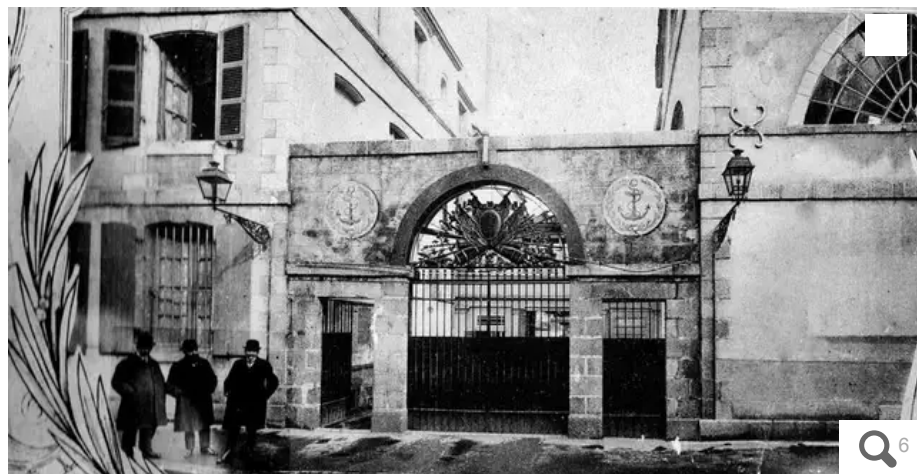
Une vue de l'entrée du lycée Dupuy-de-Lôme d'antan, avant qu'il ne soit détruit par les bombardements.

Le lycée de Lorient (Morbihan) invite, samedi 13 mai 2023, à une immersion passionnante dans le passé de l'établissement né voici deux siècles.