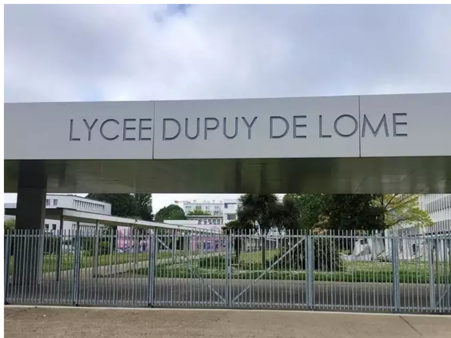
L'entrée de Dupuy-de-Lôme en 2023. Plus tout à fait la même...

Qui était Stanislas Henri Dupuy de Lôme ? Sait-on qu'il était ami de Jules Vernes ? Que son prototype de sous-marin a sans doute inspiré le fameux Nautilus de 20 000 lieues sous les mers ? Que l'établissement, déménagé à Guéméné-sur-Scorff au cœur de la Seconde Guerre mondiale, fut le premier lycée mixte de France ?