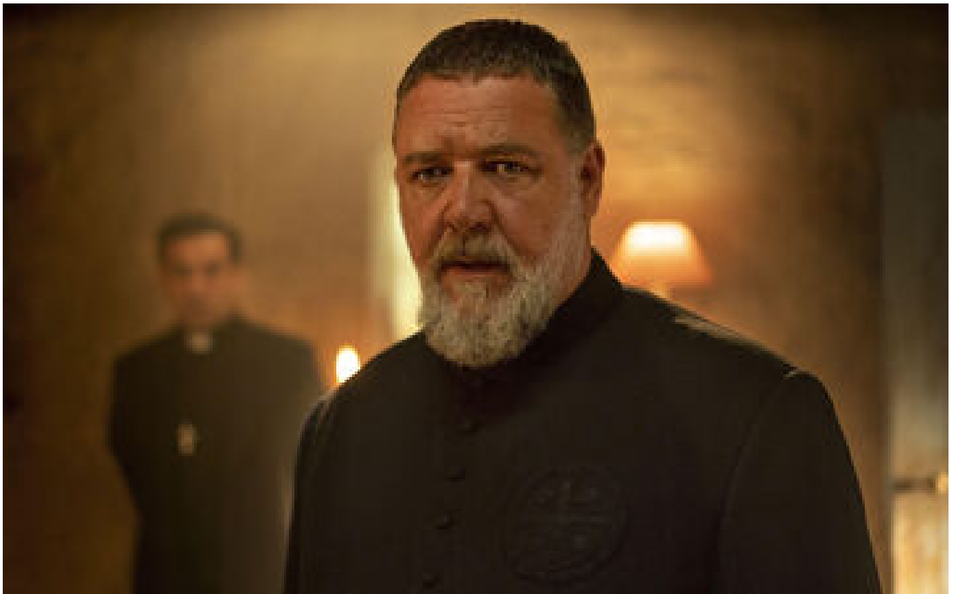
« L'Exorciste du Vatican » : Russell Crowe en roue libre