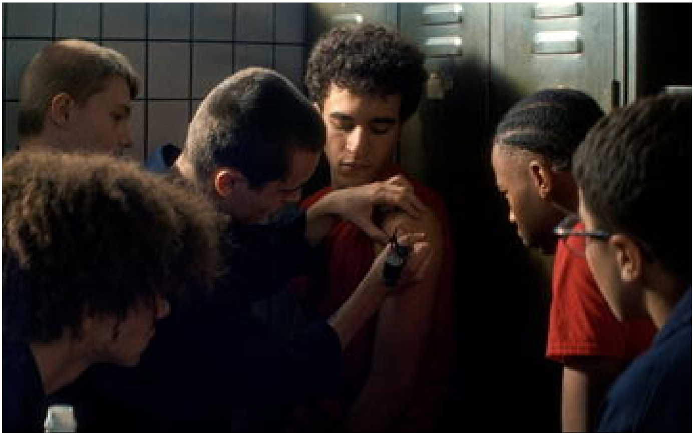
« Le Paradis » : l'amour plus fort que la prison