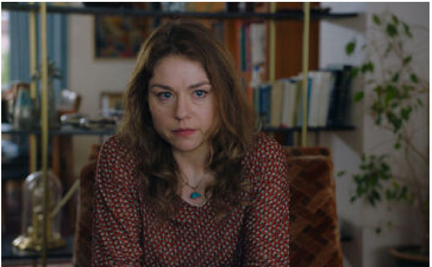
« La Fille d'Albino Rodrigue » : Émilie Dequenne impressionne en mère menteuse