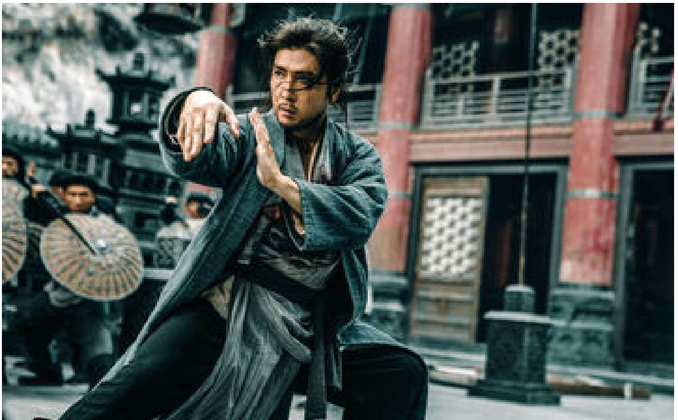
Sorties cinéma du 10 mai : « Sakra », « l'Exorciste du Vatican »... les films à voir (ou pas) P