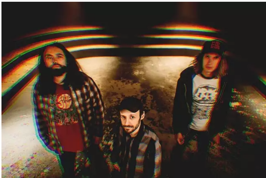
Mars Red Sky, l'un des groupes programmés dans ce premier festival métal en pays de Lorient.

Le jeune luthier y va sereinement. Seul ou presque. De l'idée à l'organisation jusqu'à la scène du festival qu'il bâtit lui-même. « J'aurai des coups de main, bien sûr, sur les trois jours du festival. Mais pour le reste, je m'occupe de tout et ça roule. La jauge du festival c'est 300 personnes max par soir dans un lieu fermé, sécurisé. » Sa programmation intègre des groupes français, dont deux auront joué, au préalable, sur la scène du Hellfest.