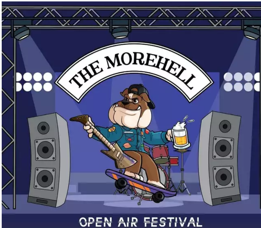
L'affiche de ce premier Morehell Open Air festival.