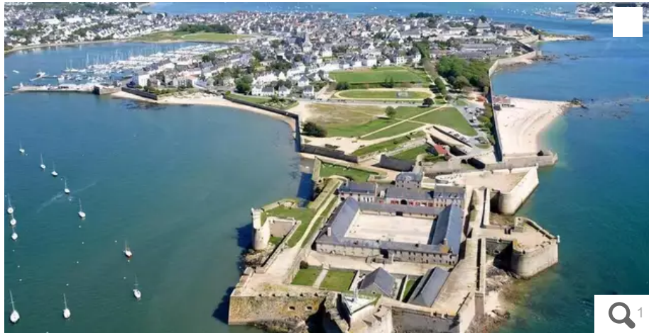
La citadelle de Port-Louis vue du ciel.

La citadelle de Port-Louis, dans le Morbihan, est en compétition pour représenter la Bretagne au concours du Monument préféré des Français. Ses deux autres concurrents sont : le château du taureau à Plouezoc'h (Finistère) et le Domaine départemental de la Roche-Jagu à Ploëzal (Côtes-d'Armor). Vous avez jusqu'au 26 mai 2023 pour voter.